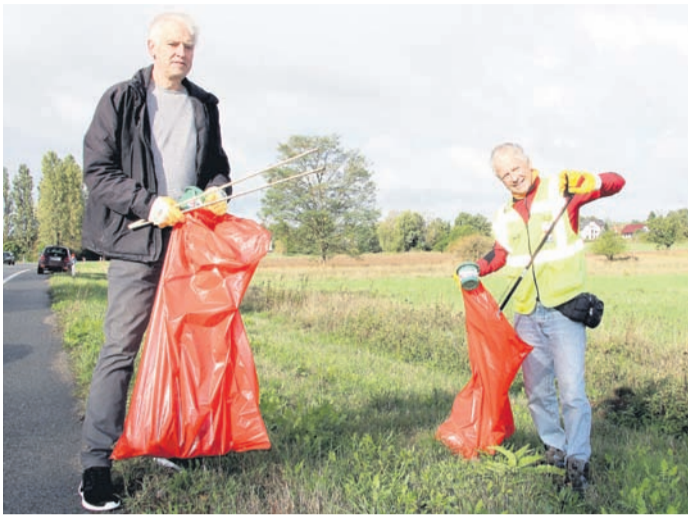
Knapp 350 fleißige Müllsammler wurden im September beim Aktionstag „Alles sauber!“ gezählt. Eingebettet ins Rahmenprogramm war damals auch eine Fragebogen-Aktion. Deren Ergebnisse dienen nunmehr als Ansporn für zielgerichtetes Handeln.

Insbesondere rund um die örtlichen Bahnhöfe sowie in Parkanlagen, im Umfeld der Schulen und an Landstraßen, vorrangig links und rechts vom Rödermarkring, gebe es verstärkt Handlungsbedarf. Dort sei es oft zu schmutzig. Mehr