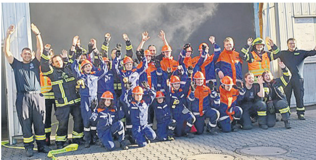
In mehr als zehn nachgestellten Einsätzen durfte sich der Nachwuchs versuchen.

Personensuche versuchen. Zu den spektakulärsten Einsätzen zählten dieses Mal eine nächtliche Personensuche, bei denen sich der 1. Vereinsvorsitzende der Freiwilligen Feuerwehr Eppertshausen 1898 am Waldrand versteckte und durch die Jugendlichen gefunden werden musste, ein (tatsächlich) brennender Busch, der abgelöscht werden musste, sowie eine Personenrettung