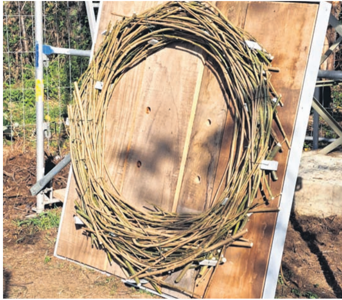
Die neue Storchplattform.

OWK Eppertshausen investiert 60 Stunden in die Erneuerung