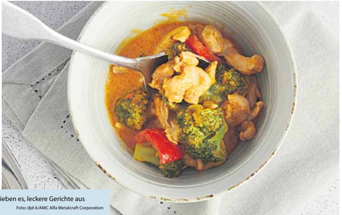
Rotes Thai-Curry: Viele Hobbyköche lieben es, leckere Gerichte aus der ganzen Welt auszuprobieren.

(DJD-K). Viele Feinschmecker lieben es, leckere Gerichte aus der ganzen Welt auszuprobieren. Mit fertigen Gewürzmischungen können Hobbyköche ganz unkompliziert wahre Geschmacksexplosionen auf den Teller zaubern. Die AMC Gewürzmischungen ohne zugesetztes Salz etwa gibt es für die verschiedensten Gerichte. So verleiht beispielsweise das Asian Trio asiatischen Speisen wie Pho Bo, Kung Pao oder einem Linsen-Dal das gewisse Etwas. Zum Gelingen der Gerichte trägt auch das richtige Kochgeschirr bei. Perfekt für das Pfannenrühren der asiatischen Küche ist beispielsweise ein Wok mit Hochraumdeckel und integrierter Temperaturkontrolle. Informationen zur Zubereitungsmethode sowie köstliche Rezepte aus aller Welt gibt es unter www.kochenmitamc.info .