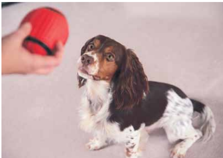
Auf das Alleinsein reagieren Hunde häufig mit stressbedingtem Verhalten wie Bellen, Jaulen oder Winseln.

Nach den coronabedingten Einschränkungen sind auch Reisen und Kurztrips wieder möglich. Ist der Vierbeiner noch nicht an Autofahrten gewöhnt, sollten Sie ihm auch im Fahrzeug ein Gefühl der Sicherheit und Geborgenheit vermitteln. Dabei ist das Adaptil Transport-Spray hilfreich, das 15 Minuten vor Abfahrt im Auto oder auf der Autodecke des Hundes versprüht wird und den Hund während der Autofahrt entspannt.