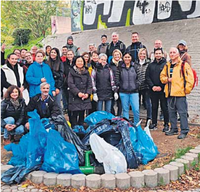
Ein Team von Amadeus bei der Müllsammelaktion.