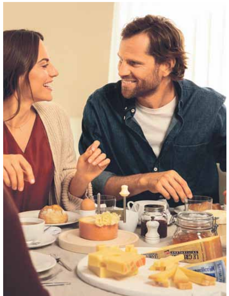
Schweizer Käse – Das Gute leben.

men Tag mitgeben. So denken alle Gäste beim nächsten Käsegenuss daheim an die gemeinsame Zeit, den intensiven Austausch und viele wertvolle Momente. Kurzum: das Gute leben.