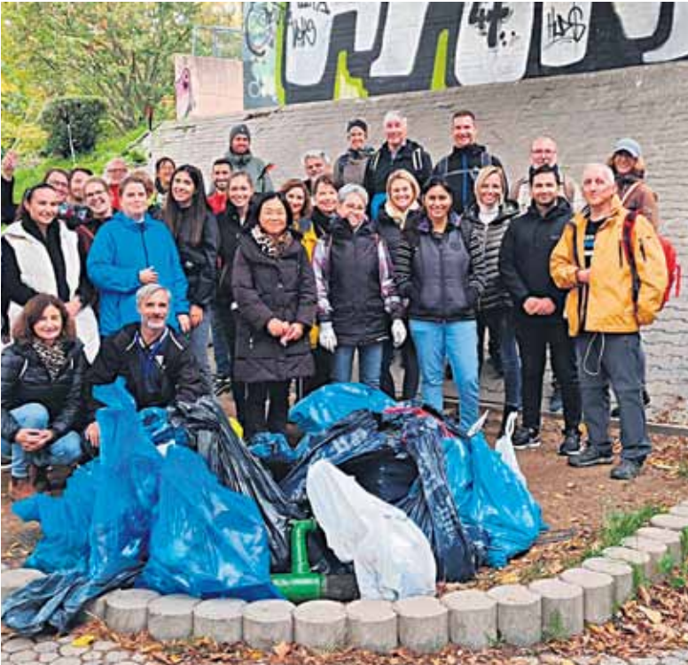
Ein Team von Amadeus bei der Müllsammelaktion.