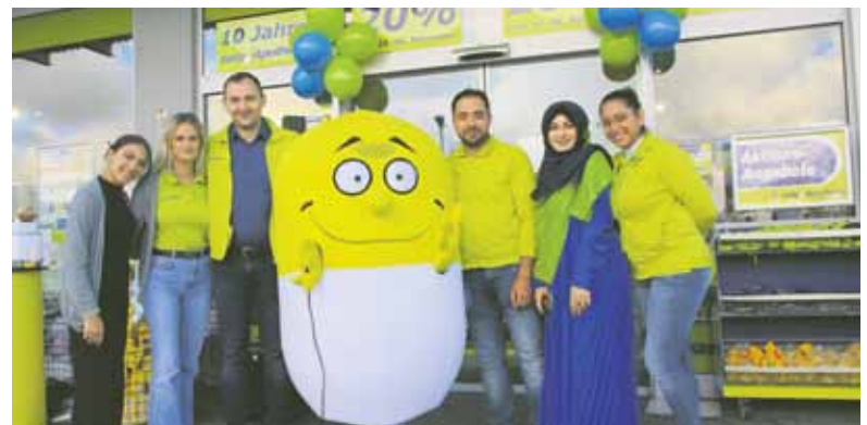
Ein Teil des Apotheken-Teams mit dem Maskottchen.

boten. Zum 10-jährigen Bestehen gab es extra ein Angebotsprospekt. Außerdem bot das Promotions-Team der Easy-Apothekengruppe frisch gemixte Smoothies an. Ein Glücksrad machte am Wochenende und den beiden Aktionstagen viele Umdrehungen. Das Maskottchen der EasyApotheke sorgte für frohe Stimmung.