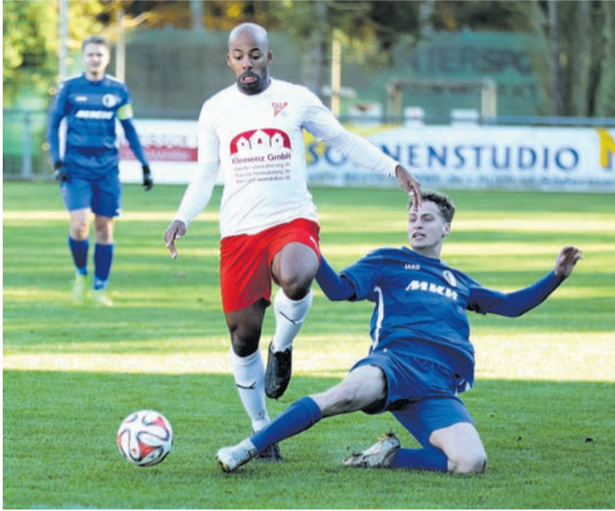
Das Spitzenspiel der A-Liga zwischen Viktoria Urberach (blaue Trikots) und dem FV Eppertshausen endete 0:0.