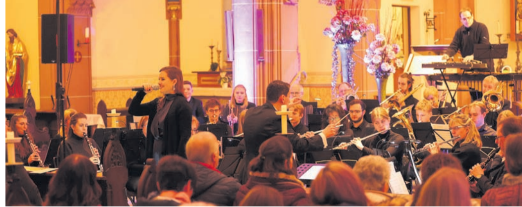
Das Konzert sorgte am Sonntag für eine volle St. Nazarius-Kirche.

Ober-Roden (NHR) - Mit Spannung fieberten die Musikerinnen und Musiker des großen Blasorchesters des Musikvereins 03 Ober-Roden nach einem arbeitsreichen Probenwochenende in der Burg Waldau dem besonderen Klang der vollbesetzten Kirche St. Nazarius entgegen. Sowohl die Konzertgäste als auch die Musikerinnen und Musiker wurden nicht enttäuscht und durften einem klanglichen Meisterwerk lauschen.