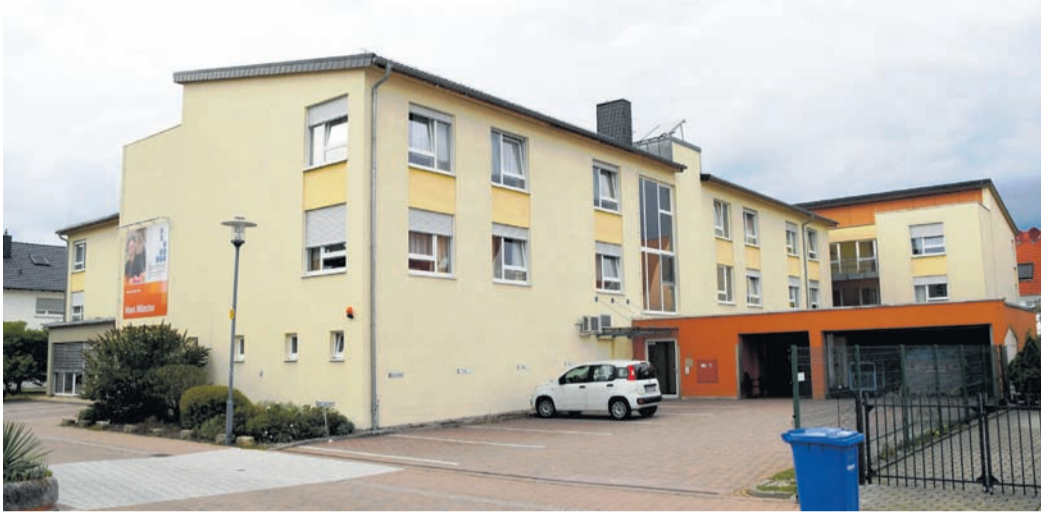
Auch die Senio-Immobilie in der Wilhelm-Lehr-Straße in Münster, in der die Gersprenz gGmbH Dauer- und Kurzzeitpflege anbietet, soll 2023 verkauft werden.

Eppertshausen/Münster (jedö) Im September fasste der Kreistag Darmstadt-Dieburg mehrere Beschlüsse, wie sich seine Mitglieder in der nächsten Verbandsversammlung des Zweckverbands Senio verhalten sollen. Das fast einstimmige Meinungsbild: Die Vertreter des Landkreises (im Verband nur eine Minderheit neben den Vertretern der ebenfalls finanziell und personell an Senio beteiligten Kommunen Groß-Zimmern, Münster, Eppertshausen, Reinheim, Groß-Bieberau, Fischbachtal, Otzberg und Groß-Umstadt) sollen nicht nur für die Auflösung des Verbands votieren, sondern auch für die Eingliederung der Senioeinrichtungen in die Kreiskliniken sowie für die Zusammenlegung der bisher eigenständigen Senio-Pflegeschule mit dem Bildungszentrum für Gesundheit der Kreiskliniken. In der Kreistags-Sitzung am Montag präzisierten weitere Beschlüsse den Weg, der sich aber noch eine Weile hinziehen wird. Von der ursprünglich erhofften Auflösung des öffentlich-rechtlichen Zweckverbands „zum 31.12.2022“, wie es im September noch hieß, ist inzwischen keine Rede mehr. Im neuen Beschluss vom Montag heißt es stattdessen: „Der Auflösung des Zweckverbands Senio wird zugestimmt. Der Zeitpunkt der Auflösung ergibt sich aus dem vorgesehenen Verkauf der Im-