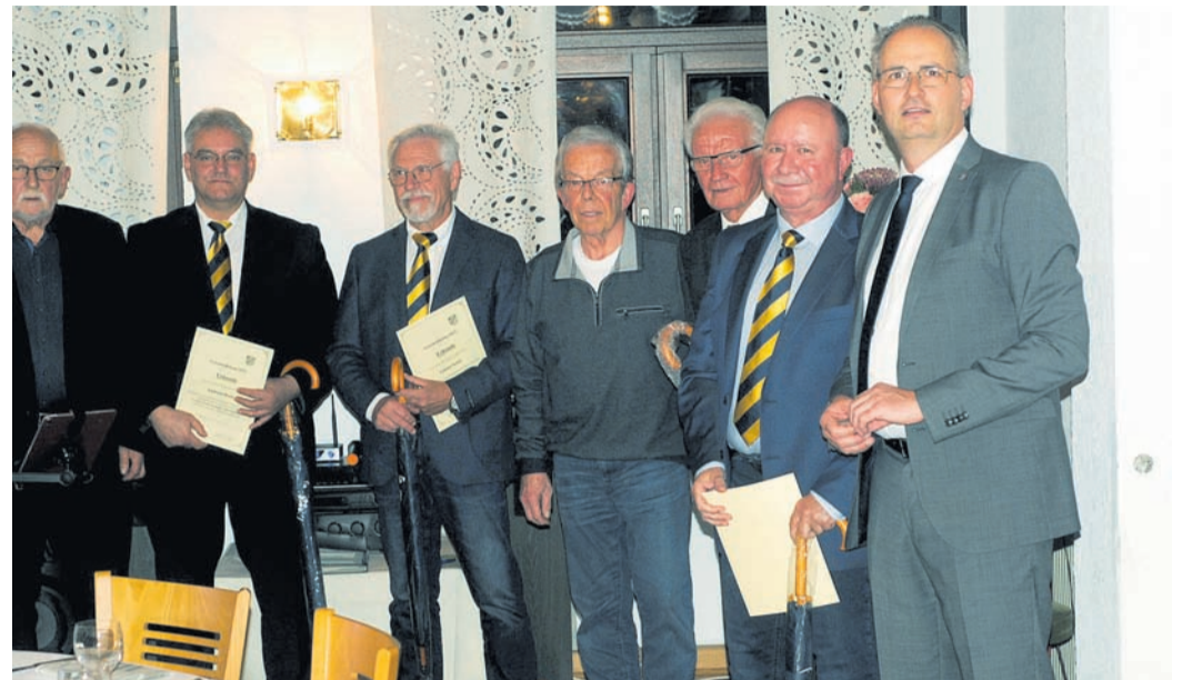
Der TAV stellte mit acht zu ehrenden Personen die größte Gruppe.