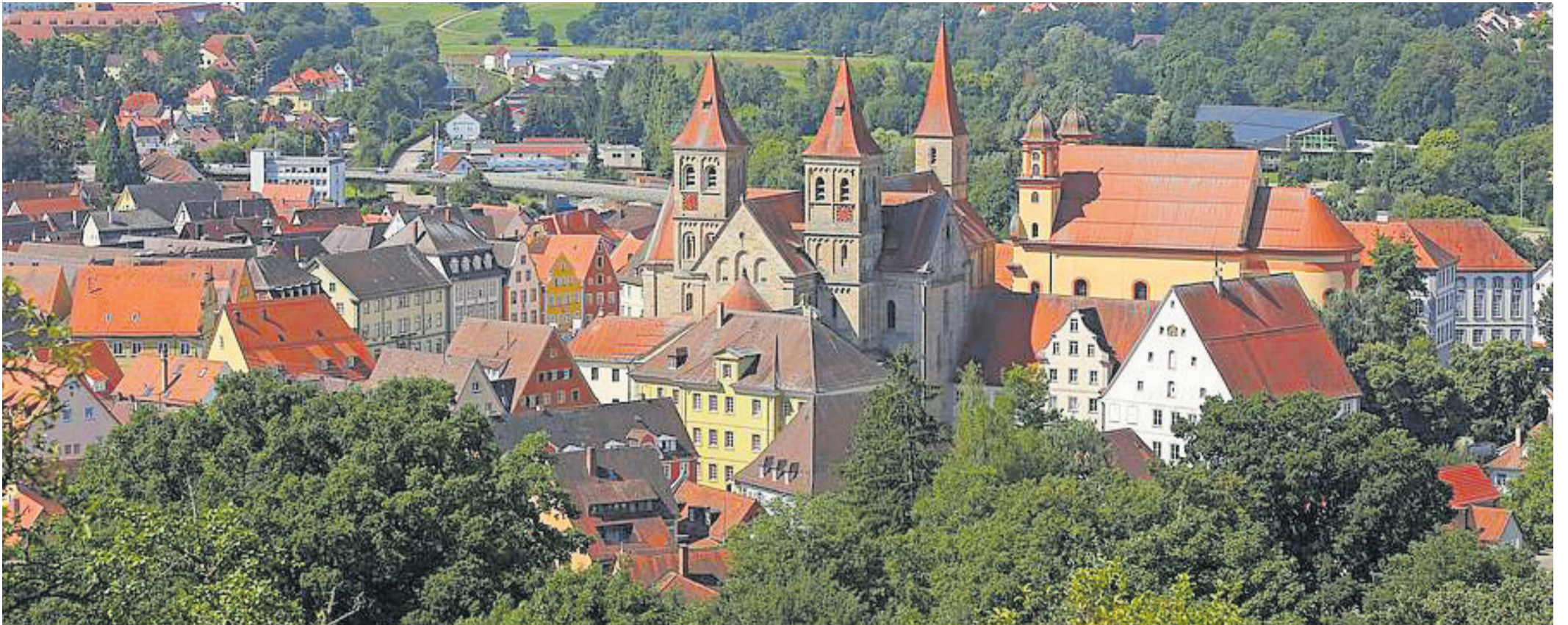
Das schwäbische Ellwangen an der Jagst besitzt eine Fülle an Bauschätzen aus über 1.250 Jahren Stadtgeschichte.