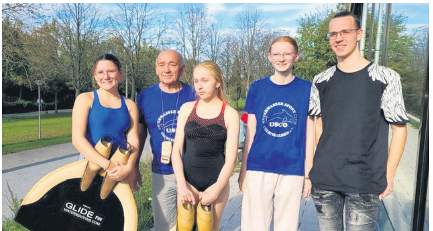
Vier Mitglieder des USCO nahmen an den Offenen Hessischen Meisterschaften im Flossenschwimmen und Streckentauchen teil.