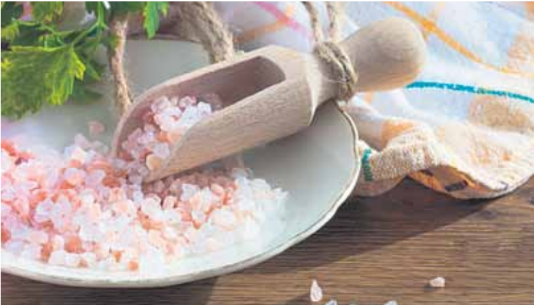
Salz gibt es in vielen Varianten und Farben. Dem „Himalayasalz“ verleiht Eisen seine typische Färbung.

In der Wohnung · auf der Haut · in der Suppe