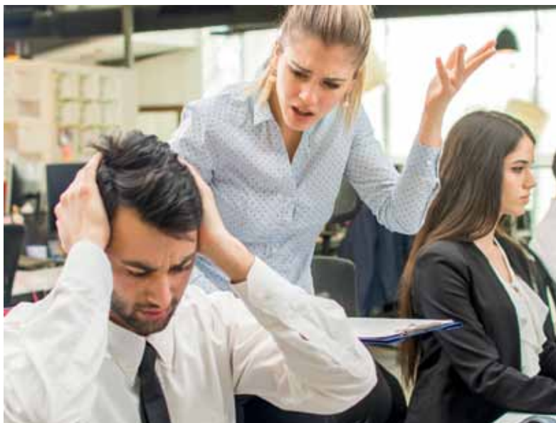
Streit unter Kollegen lähmt Betriebsabläufe und kostet am Ende nur Zeit, Geld und Nerven.

Dann kommt es darauf an, rechtzeitig einzugreifen und gezielt auf eine Lösung hinzuwirken. Dazu ist es unter anderem ratsam, frühzeitig mit den Mitarbeitenden zu sprechen. „Vorgesetzte stehen hier besonders in der Verantwortung“, sagt Heptner, „unabhängig davon, ob sie einen Streit zwischen Beschäftigten moderieren oder selbst am Konflikt beteiligt sind. Sie müssen die Streithähne an einen Tisch bringen und darauf hinwirken, dass alle Beteiligten sachlich bleiben und persönliche Angriffe ausbleiben.“ Entscheidend sei, die wahren Hintergründe zu erkennen, die richtigen Schlüsse zu ziehen und das kreative Potenzial zu nutzen, das in solchen Auseinandersetzungen