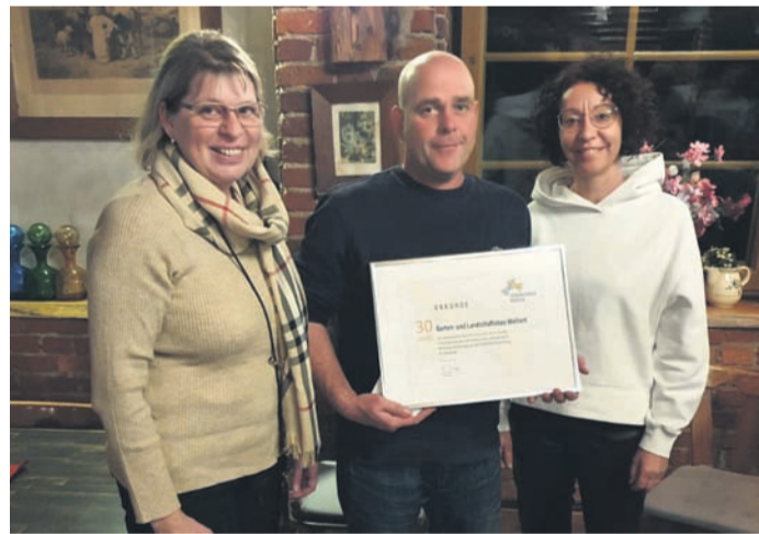
Die Firma Galabau Weihert konnte für 30-jähriges Firmenjubiläum geehrt werden.