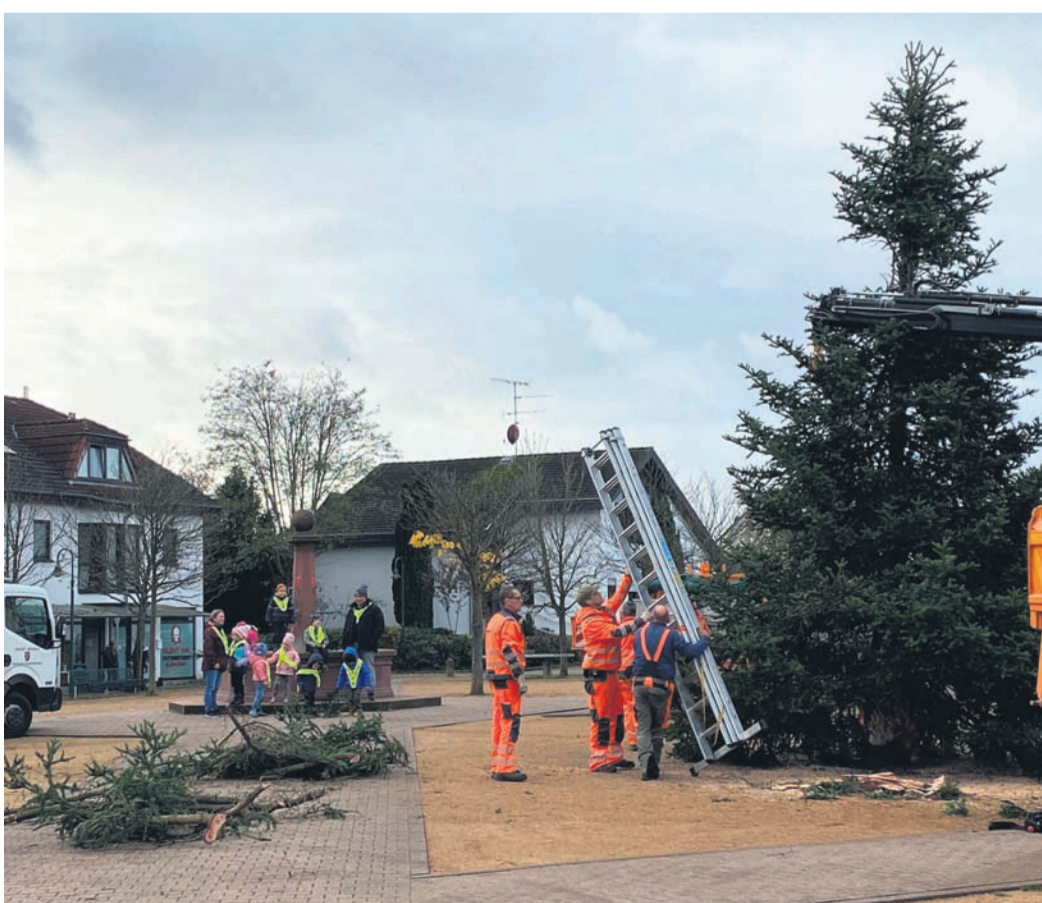
Eine prächtige Tanne wurde am vergangenen Wochenende auf dem Franz-Gruber-Platz aufgestellt - unter den wachsamen Augen einiger Kitakinder. Zum Weihnachtsmarkt wird der Baum mit seinem Lichterglanz bald die Besucher erfreuen.

06078 70-3372 immobilien@sparkasse-dieburg.de