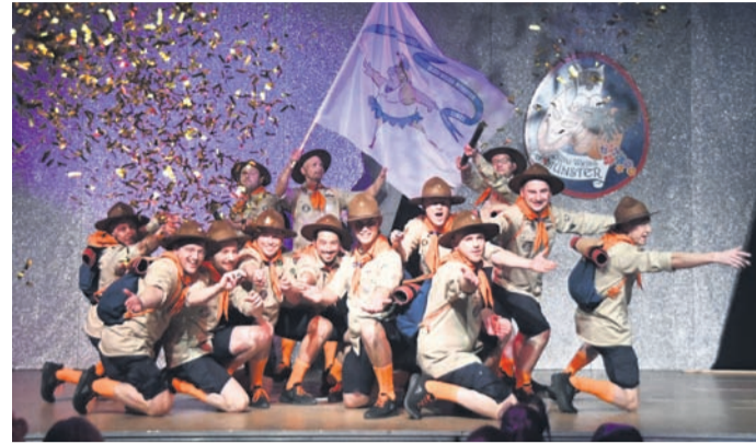
Die DJK Blau-Weiß Münster lässt im Januar und Februar weniger Gäste zu ihren Fastnachtsitzungen in die Vereinshalle ein. Zudem reduziert sie die Zahl der Vorstellungen von vier auf drei.

Dennoch wolle man „den Schutz unserer Mitwirkenden, des Dienstpersonals sowie unserer Besucher nicht vernachlässigen“, stellt Müller heraus. Das Credo laute „so viel Normalität wie möglich und so viel Sicherheit wie möglich“. Die Kampagne werde „unter etwas verän-