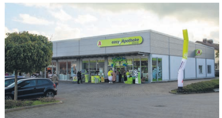
Parkplätze in der Nähe der Easy Apotheke sind vorhanden.