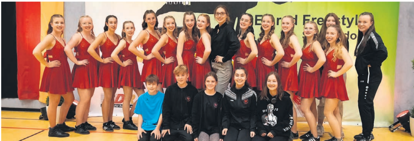
Die Teilnehmer des TSV Dudenhofen.

bevor es zum Springen, Werfen, Schwingen, Hangeln und Rollen an die Geräte ging. Danach folgten die 1-3 Jährigen, nach einem kurzen Bewegungslied zum Aufwärmen konnten die Kindern die vielen Turnstationen gemeinsam mit ihren Papas ausprobieren. Den Kindern machte es viel Freude ihren Papas zu zeigen, was sie schon alles in den Turnstunden gelernt haben. Und auch viele Papas probierten sich einmal selbst an den verschiedenen Turnstationen aus. Der JSK Rodgau bietet zwölf verschiedene Turnstunden für alle Kinder von 1-6 Jahren an. Weitere Infos zu allen Stunden unter www.jskrodgau.de oder per email an kinderturnen@jskrodgau.de .