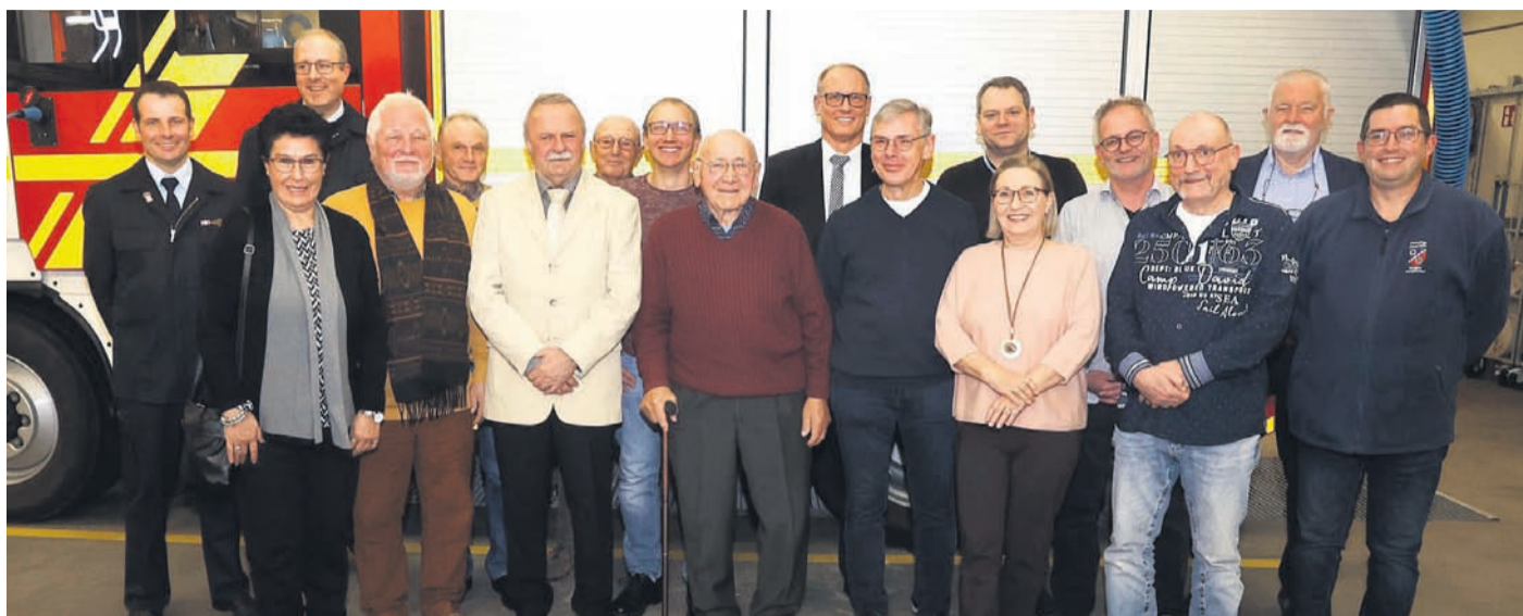
Zahlreiche treue Vereinsmitglieder wurden geehrt.

Unabhängiges Wochenblatt · Amtsverordnungsblatt der Stadt Rodgau