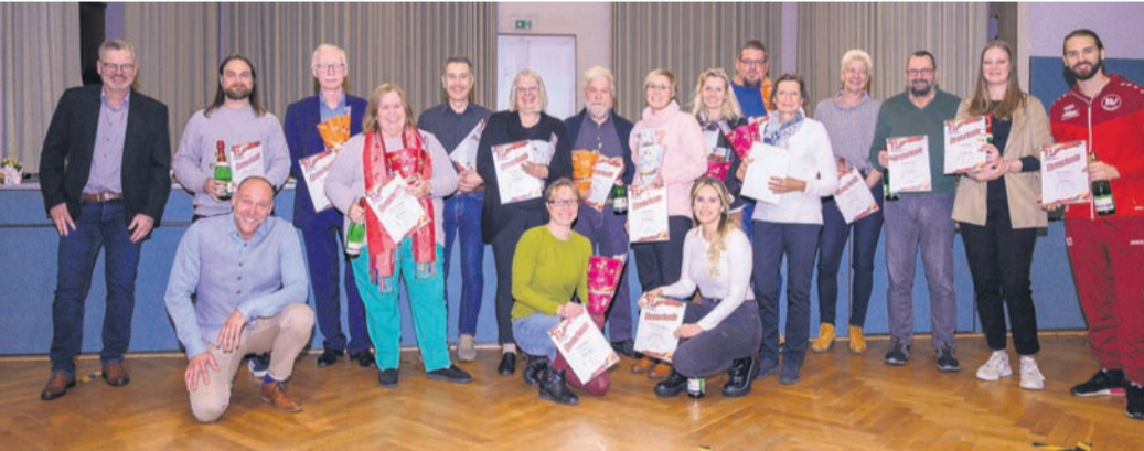
Einige der geehrten Mitglieder des TSV Dudenhofen.