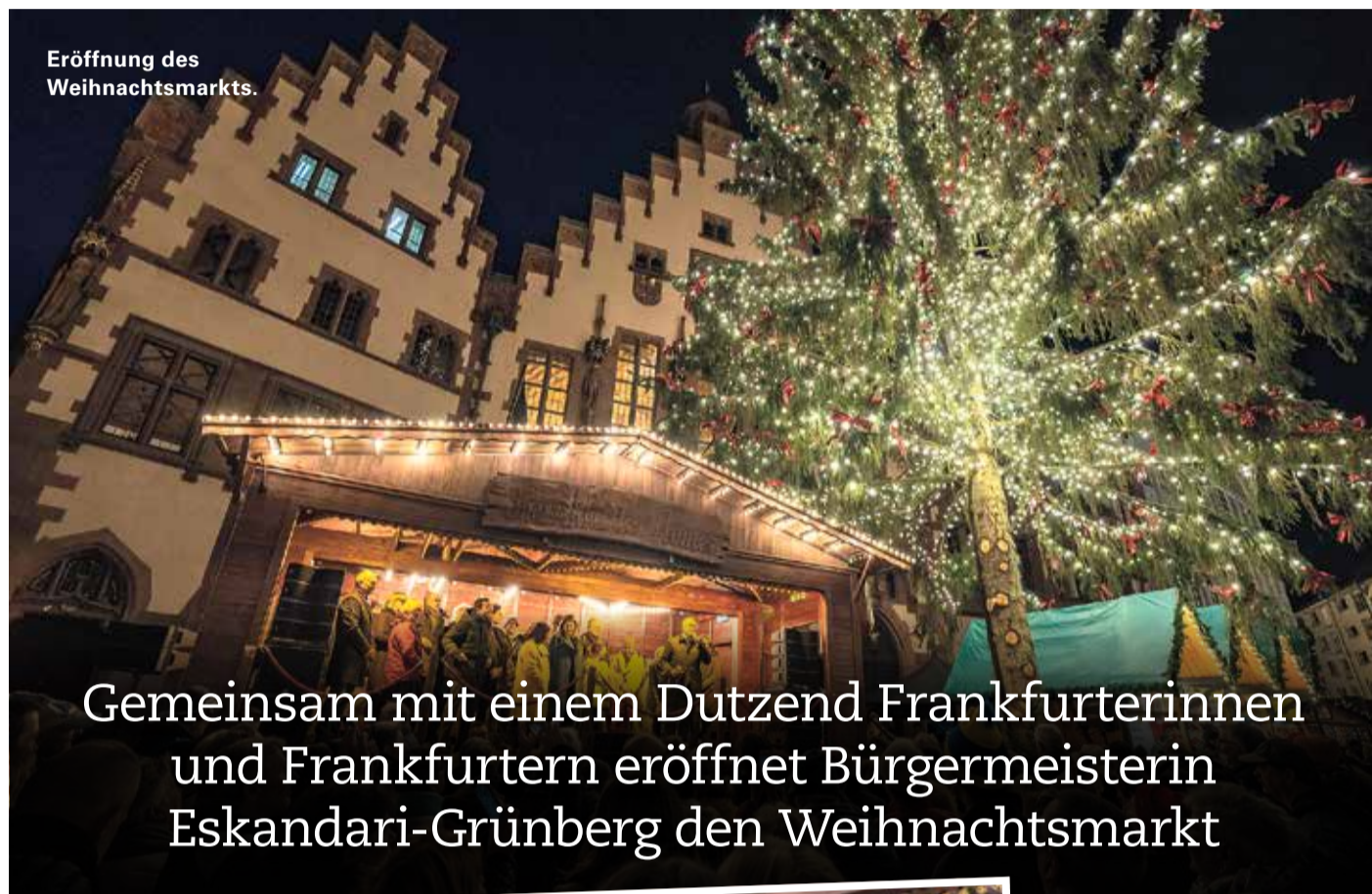
Eröffnung des Weihnachtsmarkts.