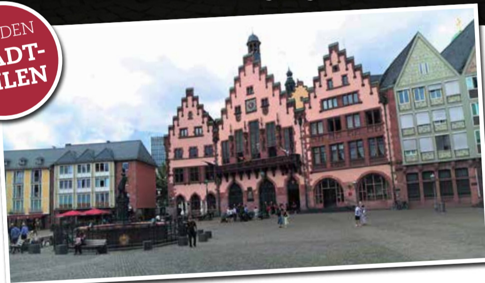
Das Rathaus auf dem Römerberg ist so imposant wie der Römerberg selbst.