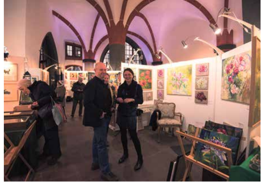
Künstlermarkt in den Römerhallen.

(Hintergrund): Der BBK Frankfurt vereint als regionaler Berufsverband inzwischen über 350 professionell arbeitende Künstler aus dem Großraum Rhein-Main. Diese prägen mit Ausstellungen und Beteiligungen an Groß-Events wie dem Museumsuferfest, der Luminale etc. das Kunstgeschehen der Metropole mit. Die Künstler aus 30 Nationen verkörpern den freien Geist der Kunst in der internationalen Stadt Frankfurt.