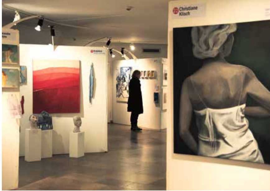
Künstlermarkt in der Paulskirche.

Die Jahresausstellung des BBK in der Paulskirche öffnet am Donnerstag (22.11.) ihre Tore. Die vierwöchige Schau zeigt Werke