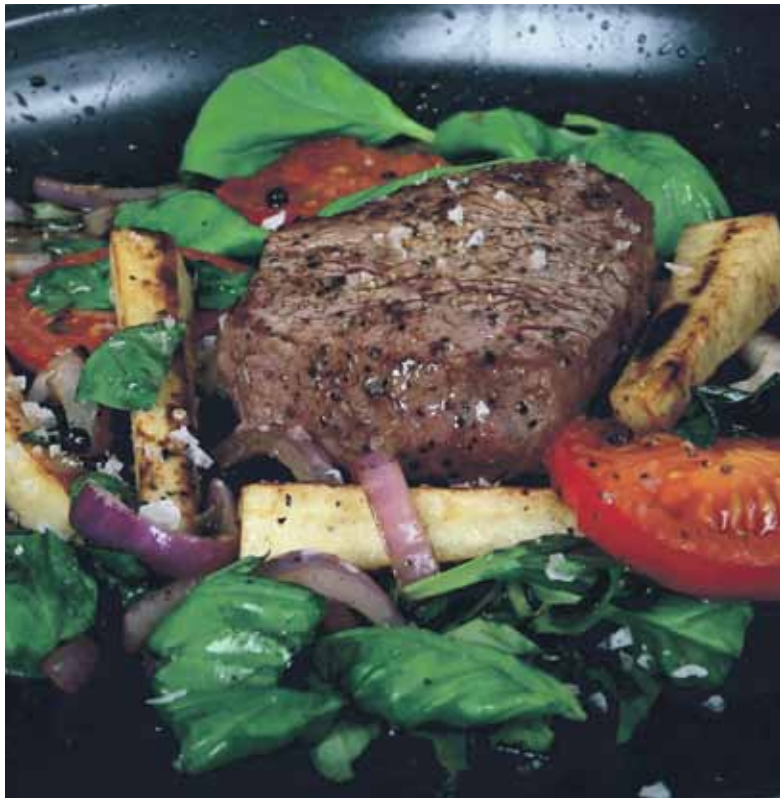
Zink ist in der Lage den Blutzuckerspiegel zu senken und ist reichlich in Rindfleisch und Meeresfrüchten enthalten.