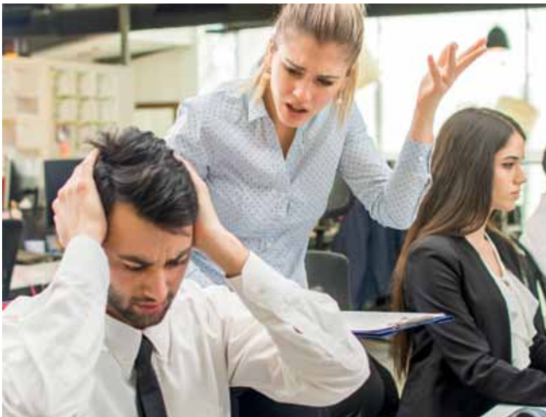
Streit unter Kollegen lähmt Betriebsabläufe und kostet am Ende nur Zeit, Geld und Nerven.