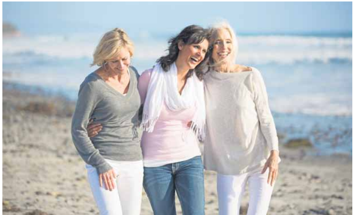
In den Wechseljahren stehen die eigenen Bedürfnisse im Fokus: Ein Kurztrip mit den Freundinnen tut gut.

Unter www.trivital-henning.de gibt es weitere Tipps.