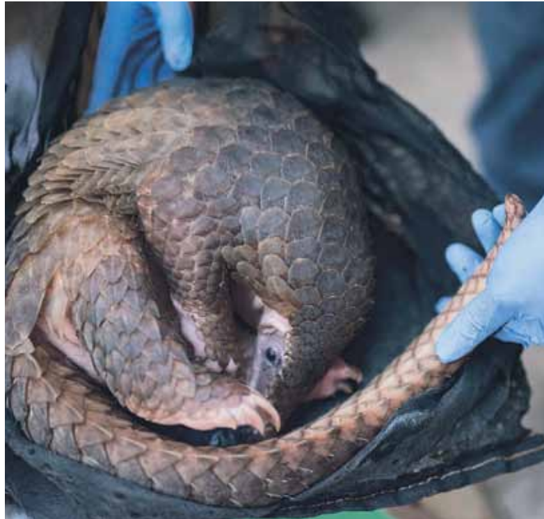
Dieses Schuppentier wurde von Tierschützern in Vietnam aus dem illegalen Wildtierhandel befreit und konnte so vor dem sicheren Tod bewahrt werden.