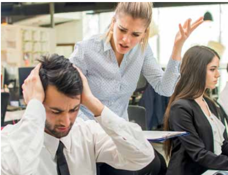
Streit unter Kollegen lähmt Betriebsabläufe und kostet am Ende nur Zeit, Geld und Nerven.