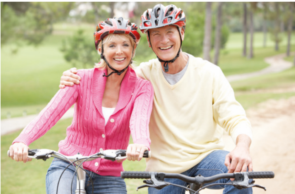
Wenn Gelenkprobleme quälen: Eine neue, rezeptfreie Knochen-Knorpel-Formel* und geeignete Bewegung können unterstützen.

(WLMS) Wenn Gelenksbeschwerden auftreten, sind die Ursachen dafür meist Schäden am Gelenkknorpel, oft verbunden mit einem Mangel an Gelenkflüssigkeit. Eine neue, patentierte und rezeptfrei erhältliche Knochen-Knorpel-Formel mit den Inhaltsstoffen Curcumin, UC-II und Vitamin C kann zu einer verbesserten