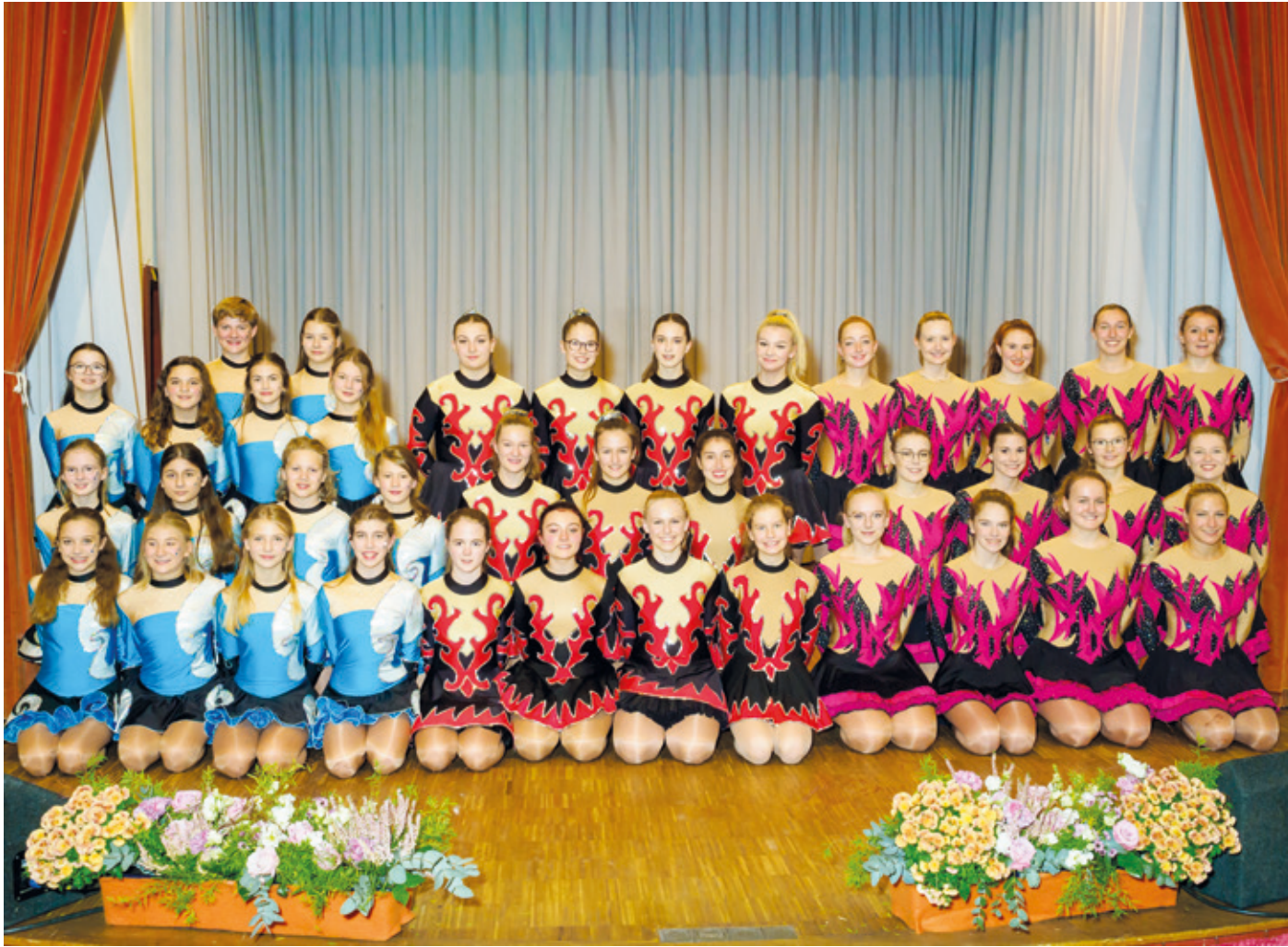
Die Jugendgarden des 1. KCA: Lollipops, Burning Steps und Große Garde.

(Arheilgen, DZ) Beim 1. Karneval Club Arheilgen fand am Samstag, den 12. November, die Kampagneneröffnung statt. Das Bürgerhaus zum Goldenen Löwen füllte sich am Abend mit vielen Karnevalsbegeisterten und so wurde die neue Kampagne mit einem dreifach donnernden HELAU eröffnet. Die Tänzerinnen und Tänzer der Mini Smarties, der M&Ms, der Lions und der Lollipops zeigten je-