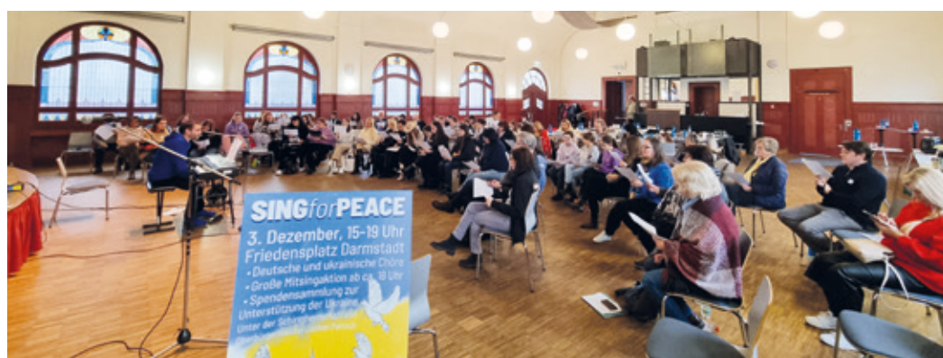
Fleißiges Üben der Sänger:innen des Projektchores am Probenstag.

Großes Friedenssingen am 3. Dezember auf dem Darmstädter Friedensplatz