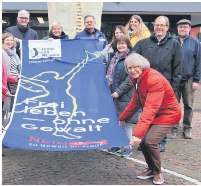
Flaggenhissen in Ober-Roden.

Laut Statistik wurden im Jahr 2021 in Deutschland bei der Polizei rund 143.000 Fälle angezeigt, bei denen Gewalt auf der Ebene von (Ex-)Paaren zu beklagen war. Bei knapp 80 Prozent der Tatverdächtigen handelte es sich nach Angaben der Ermittler um Männer. Bei gut 20 Prozent der Fälle ging die Gewalt