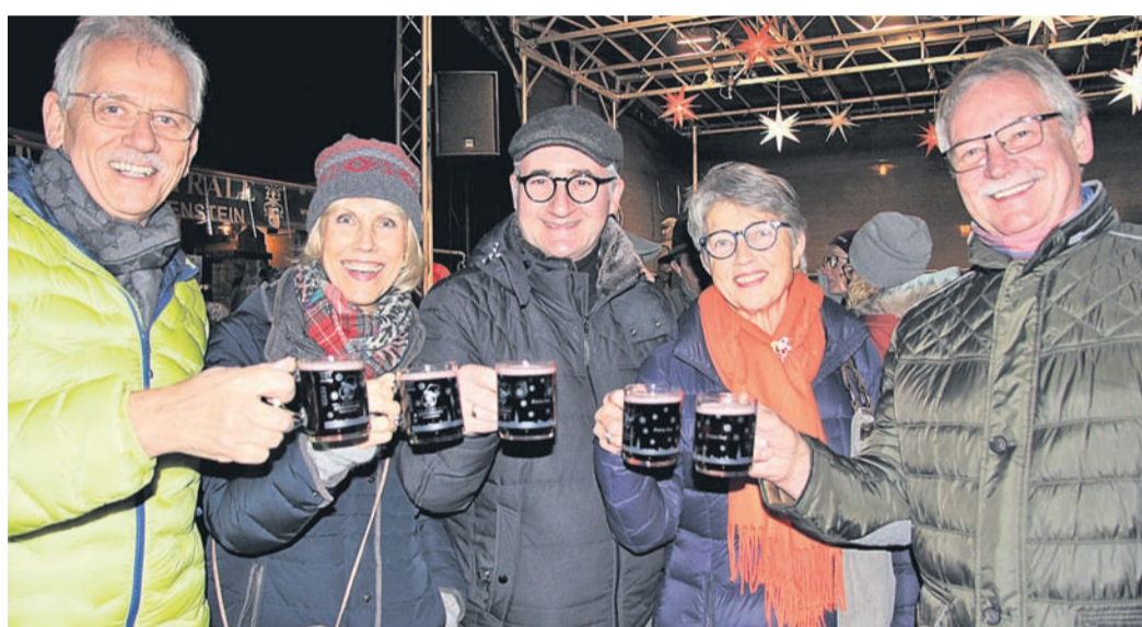
Der Glühwein aus den neuen Glastassen mit Rödermark-Dekor schmeckte beim Adventsmarkt bestens.