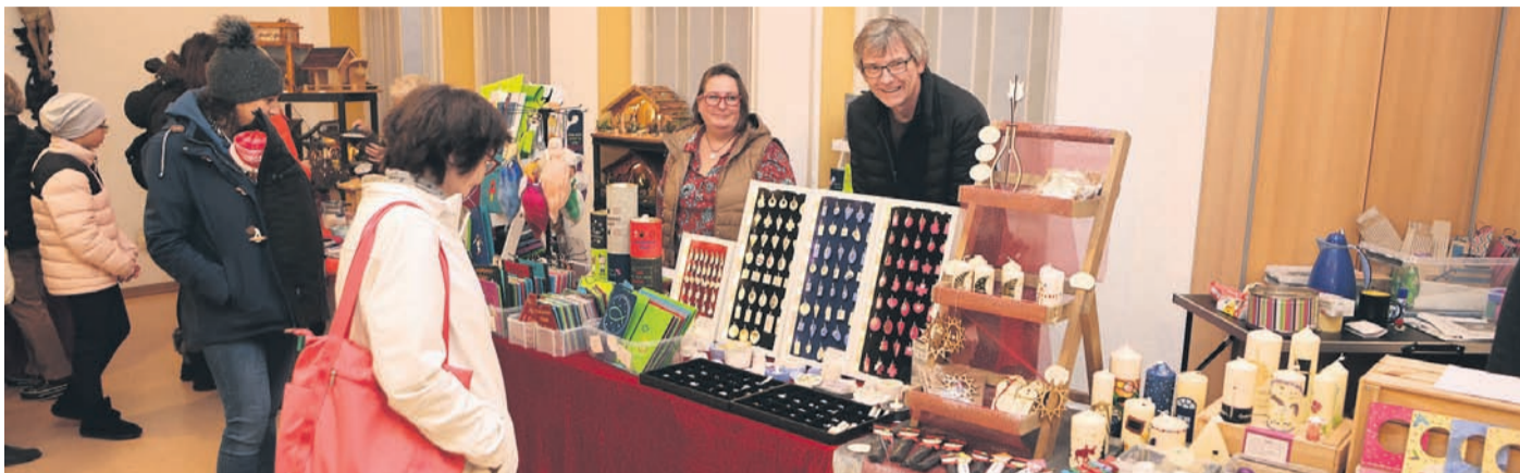
Viele Geschenkideen gab es im Forum St. Nazarius.

nachbarten Kommunen denn auch ausgiebig. An kunsthandwerklichen und kulinarischen Verlockungen herrschte kein Mangel. Die Pfarrei lockte mit potenziellen Weihnachtsgeschenken ins Forum und in den Eine-Welt-Laden. Das obligatorische Kinderkarussell drehte seine Runden, auch im Dinerhof konnte man gemütliche Sonntagsstunden erleben, der Glühwein aus den neuen Glastassen mit Rödermark-Dekor schmeckte bestens... Und das Kulturprogramm war stattlich. Instrumentalisten der Musikvereine 03 und 08, der Posaunenchor der Evangelischen Kirchengemeinde, der Musikzug der Turngemeinde... Sie alle hatten ihren Auftritt. Für einen Höhepunkt der besonderen Art hatte der kommunale Fachbereich 5 (Kultur, Heimat und Europa) die organisatorischen Weichen gestellt. Das mehrKlang-Ensemble aus Darmstadt präsentierte Chorwerke aus vier Jahrhunderten und sorgte damit im „Rodgau-dom“ für eine festliche und mitunter geradezu weihevoll Atmosphäre. „Das Publikum war beeindruckt. Wir werden das Ensemble im kommenden Jahr wieder zum Adventsmarkt ein-