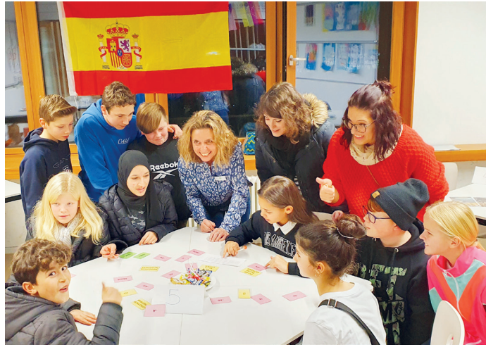
Spielerisch holten die Spanisch-Lehrerinnen und -Lehrer die angehenden Schüler ab.

Das war am Abend der offenen Schule unübersehbar! Die Hessenwaldtrommler läuteten ihn in der Kulturhalle mit eindringlichen Beats ein. Schulleiter Markus Bürger freute sich über die zahlrei-