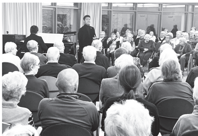
Eine aufmerksame und konzentrierte Zuhörerschaft: „Eine ganz wunderbare Idee!“, lautete der Kommentar im Wohnpark Kranichstein.

Weihnachtskonzerte im Wohnpark Kranichstein und DRK-Seniorenzentrum Fiedlersee