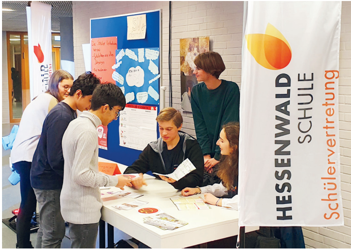
Die Schülervertretung hat an der Hessenwaldschule einen guten Stand.

(Weiterstadt, LÖR) Das Interesse an der Hessenwaldschule ist groß: Am Abend der offenen Schule pilgerten Eltern, Kinder und viele Ehemalige in Scharen in die moderne Ganztags- und Kulturschule. Schulleiter Markus Bürger konnte aus dem Vollen schöpfen: Die Pädagogik zielt auf die Begabungen der einzelnen Kinder und dass er eine der bestausgestatteten Schulen des Landkreises für digitale Medien leitet, spricht für sich.