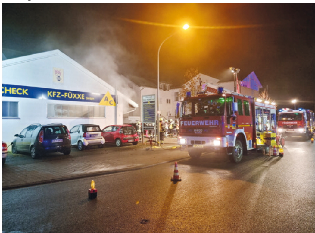
Die Freiwillige Feuerwehr Erzhausen übt die Brandbekämpfung mit Menschenrettung in der Kfz-Werkstatt Füxxe.

(KR) Am Mittwoch, den 07.12., hat die Freiwillige Feuerwehr Erzhausen ihre Jahresabschlussübung durchgeführt. Die Einsatzlage war, dass es in der Kfz-Werkstatt „Kfz-Füxxe“ in der Südlichen Ringstraße in Erzhausen bei Schweißarbeiten zu einer Verpuffung mit anschließender Brandausbreitung und starker Rauchentwicklung gekommen ist. Vier Mitarbeiter der Werkstatt, in der Übung dargestellt von Mitgliedern der Jugendfeuerwehr, wurden im Gebäude vermisst. Die Feuerwehr rückte mit vier Fahrzeugen und 27 Feuerwehrmännern und -frauen an die Einsatzstelle im Gewerbegebiet aus. Nach Absicherung der Einsatzstelle und dem Aufbau einer Löschwasserversorgung drangen drei Trupps unter Atemschutz in das brennende und stark verrauchte Gebäude ein. Durch in der Werkstatt gelagerte Winterreifen bestand eine besondere Brandlast. Zunächst war unklar, ob sich auch ein Elektrofahrzeug in der Werkstatthalle befinden könnte, dessen Akku bei Brandbeaufschlagung eine erhebliche Gefahr darstellen würde. Brennt der Akku des Elektrofahrzeugs erhöht sich die Löschdauer und der Bedarf an Löschmittel deutlich. Eine kurze Erkundung ergab jedoch, dass sich kein Elektro-