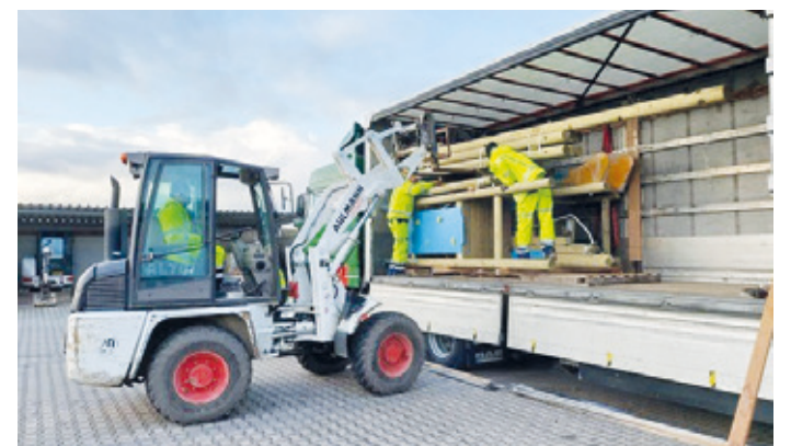
Verladung von Schulmöbeln und Spielplatz-Geräten für die Ukraine.