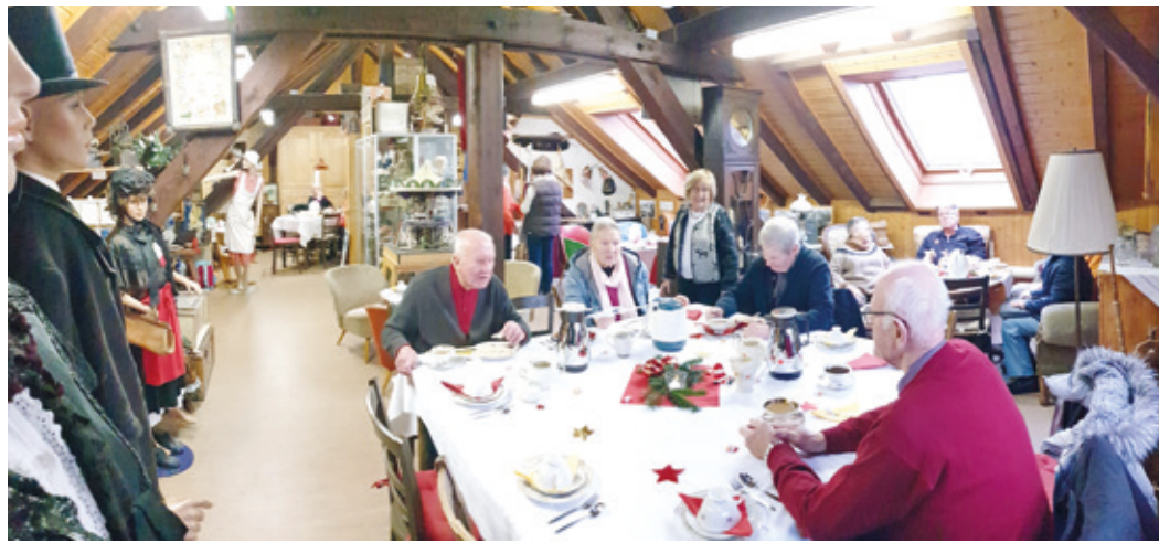
Gemütliches Beisammensein bei Kaffee und Kuchen in den Räumen des Erzhäuser Museums.

(GW) Unser Erzhäuser Museum besteht nun schon seit vielen Jahren. In den Museumsräumen im 2. Obergeschoss der alten Schillerschule in der Hauptstraße 12 findet man eine große Zahl von Exponaten, die dem interessierten Besucher beispielsweise einen wunderbaren Blick in die bäuerliche und handwerkliche Vergangenheit des Dorfes bieten. Dauerausstellungen mit Gegenständen zum Anfassen und Ausprobieren in den Räumen der alten Schule und Sonderausstellungen sollen die Erinnerung an die keineswegs so gute alte Zeit „begreifbar“ machen. „Die romantischste Rumpelkammer im Landkreis“ wird die Sammlung auf dem ehemaligen Dachboden mit den knarrenden Holzdielen inzwischen genannt. Regelmäßige Öffnungszeiten bzw. feste Besuchstermine für das Museum gibt es leider nicht, dafür fehlt es vor allem an personeller Kapazität. Führungen können jedoch mit den Mitarbeitern des Ortskundlichen Arbeitskreises vereinbart werden. Kontaktpersonen finden Sie auf der Homepage www.oak-erzhausen.de