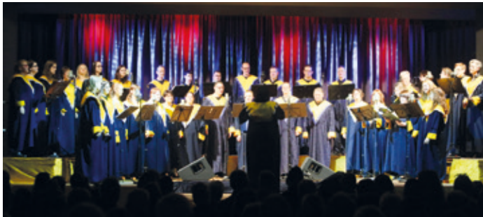
Blue Lights Konzert 2019.

Kommenden Samstag in Gräfenhausen-Weiterstadt