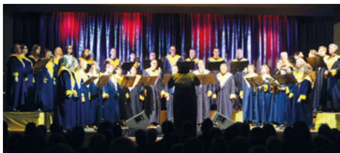
Blue Lights Konzert 2019.