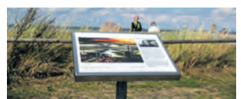
Dangaster Kunstpfad: 21 Bildtafeln mit Reproduktionen an Originalschauplätzen.

Watt? Erholung! – Urlaub mit Genuss-Garantie: Entspannung und Kultur im Nordseebad Dangast (epr) Dangast bildet den südlichen Eingang zum Weltnaturerbe Wattenmeer und blickt auf eine über 200-jährige Geschichte als Seebad zurück. Heute finden große und kleine Gäste hier alles, was einen tollen Urlaub ausmacht: Bei Flut lädt das flache Wasser vor der Küste zum Schwimmen und Planschen ein, in den bunten Strandkörben sonnen sich die Eltern, während der Nachwuchs eifrig Sandburgen baut. Bei Ebbe bieten sich ganz andere, nicht weniger aufregende Möglichkeiten: Die einzigartige Naturlandschaft des Wattenmeers steckt voller Leben, das sich am besten bei einer geführten Wattwanderung erleben lässt. Dangast punktet zudem mit einem besonderen Kunst- und Kulturprogramm. Galerien, Ateliers und das Künstlerhaus Franz Radziwill ziehen ebenso die Blicke auf sich wie beeindruckende Kunstwerke und Skulpturen aus Stein und Metall, die im gesamten Ort zu sehen sind. Mehr unter www.reiseplaza.de/dangast