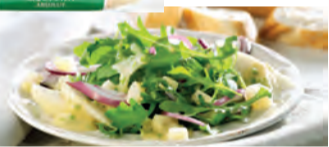
* Sauermilchkäse enthält ~30 % Eiweiß und ~0,5 % Fett. Proteine tragen zu einer Zunahme an Muskelmasse bei. Neben einer ausgewogenen Ernährung ist ausreichend Bewegung wichtig für das körperliche Wohlbefinden.

Zubereitung: Rucola waschen und trockenschleudern. Zwiebeln schälen, halbieren und in Scheiben schneiden. Harzbube Handkäse würfeln. Gewaschenen Schnittlauch in Röllchen schneiden. Birnen schälen, vierteln und in Stifte schneiden. Obstessig mit Senf, Zucker und Honig vermengen, je 1 Prise Salz und Pfeffer dazugeben, Gemüsebrühe und das Öl unterrühren. Birnen, Käsewürfel, Zwiebeln und Schnittlauch in der Vinaigrette wenden und mit dem Rucola anrichten. Baguette in Scheiben schneiden und dazu reichen.