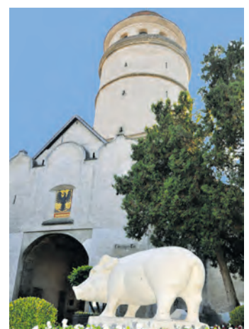
Interessante Einblicke in die Geschichte Nördlingens gibt es auch im Stadtmuseum im Löpsinger Turm.

Wie ein Schwein die Stadt gerettet haben soll – Spannende Geschichten rund um Nördlingen locken Besucher an (epr) Die ehemals Freie Reichsstadt Nördlingen hat einiges zu bieten: Neben interessanten Museen wie dem Bayerischen Eisenbahnmuseum und dem RiesKraterMuseum gibt es den Geopark Ries, in dem man viel über den Meteoriteneinschlag vor 14,5 Mio. Jahren erfahren kann. Wer gerne noch tiefer in die Stadtgeschichte blicken möchte, reserviert sich eine 1,5-stündige Führung auf der Stadtmauer, die einzige rundum begehbbare in ganz Deutschland. Vielleicht hört man hier auch davon, wie eine Sau die Stadt Nördlingen 1440 angeblüh vor einem Überfall gerettet hat. Weitere Informationen unter www.reiseplaza.de/noerdlingen