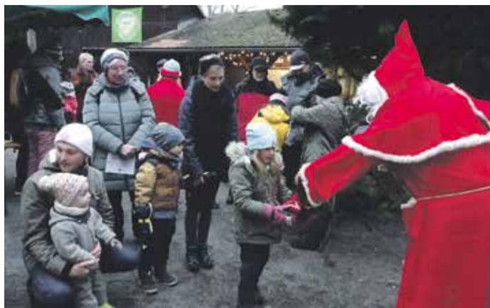
Hoher Besuch bei den OWK-Kindern.

Durch das Singen aus vielen Kehlen ließ der Nikolaus nicht lange auf sich warten. Kleine und große Kinder kamen der Aufforderung fix nach, als der Nikolaus nach einem Gedicht oder Lied fragte. Zur Belohnung bekamen sie eine gut gefüllte Tüte mit allerlei