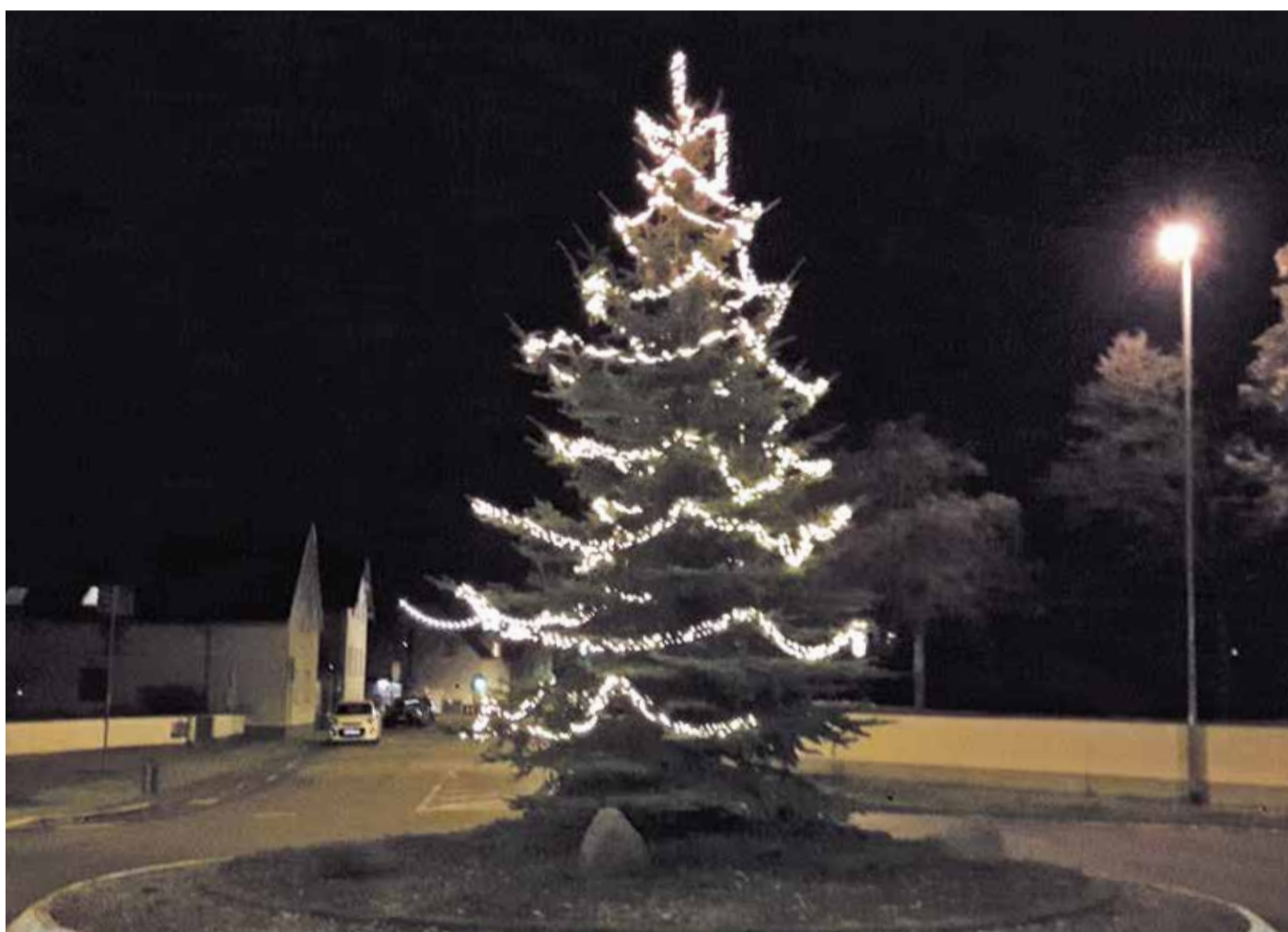
In voller Pracht erstrahlt der Weihnachtsbaum auf dem Kreisel in Wolfskehlen.

Der Freizeitclub „Eckler 82“ hat einen Baum mit Beleuchtung gespendet