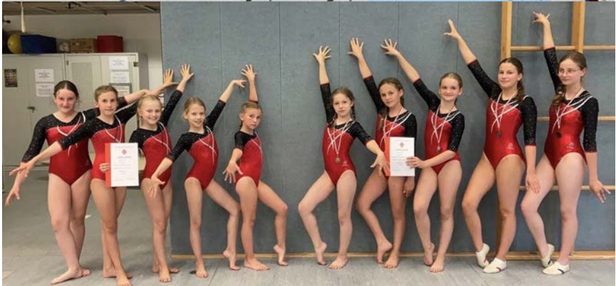
Unsere drei P-Mannschaften