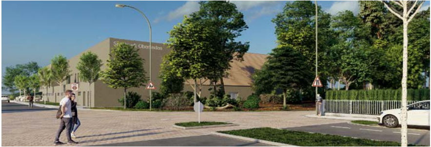
Ansicht von der Berliner Allee aus der Stadt kommend

Auf dem Hallendach wird die Photo-voltaikanlage installiert. Auf dem Dach des Nebengebäudes befinden sich das Lüftungsaußengerät und die Wärmepumpe. Sämtliche Dachflächen werden komplett mit einer extensiven Dachbegrünung versehen, so dass Regenwasser gespeichert werden kann. Das Regenwasser wird einer Zisterne unter dem Parkplatz zugeführt und kann für die Bewässerung der Grünflächen verwendet werden. Überschüssiges Wasser versickert über Rigolen auf dem Grundstück. Und so soll die neue Halle dann aussehen: