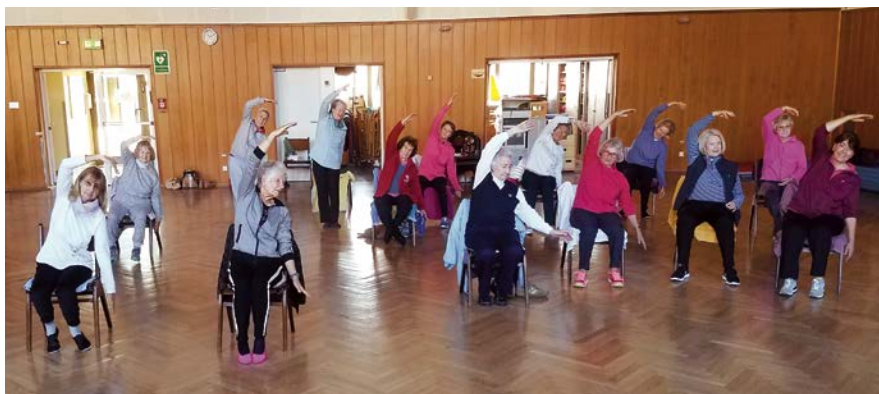
Frauengymnastik am Mittwoch

Möchtest du etwas für dich, deine Fitness und deine Gesundheit tun? Sicherlich wirst du beim TVL fündig. Bist du noch unentschlossen, kannst du dich gerne von unserem lizenzierten Fitness- und Gesundheitsteam beraten lassen. Die ersten beiden Termine zum Kennenlernen sind dabei kostenfrei.