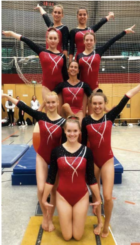
Die Regionalligamannschaft freut sich über Rang 4

Der zweite und dritte Wettkampf der diesjährigen Regionalligasaison wurde am 25. September und am 2. Oktober in Baunatal bzw. Ketsch bei Mannheim ausgetragen. Trotz stabiler Übungen konnte die Mannschaft nicht an die Platzierung des ersten Wettkampfes anknüpfen. Mit ihren gezeigten Leistungen erturnten sich die Damen die jeweiligen Tagesränge 5 und 4 und rangierten vor dem letzten Wettkampftag in der Tabelle auf Platz 4. Ende Oktober stand dann das Saisonfinale an, bei dem die Mannschaft nochmal alles zeigte und verdient auf dem 2. Tagesrang landete. Mitsamt den Ergebnissen der vorherigen Wettkämpfe belegte der TV Langen den 4. Platz in der Gesamttabelle und schließt damit mit einem tollen Ergebnis die diesjährige Regionalligasaison ab.