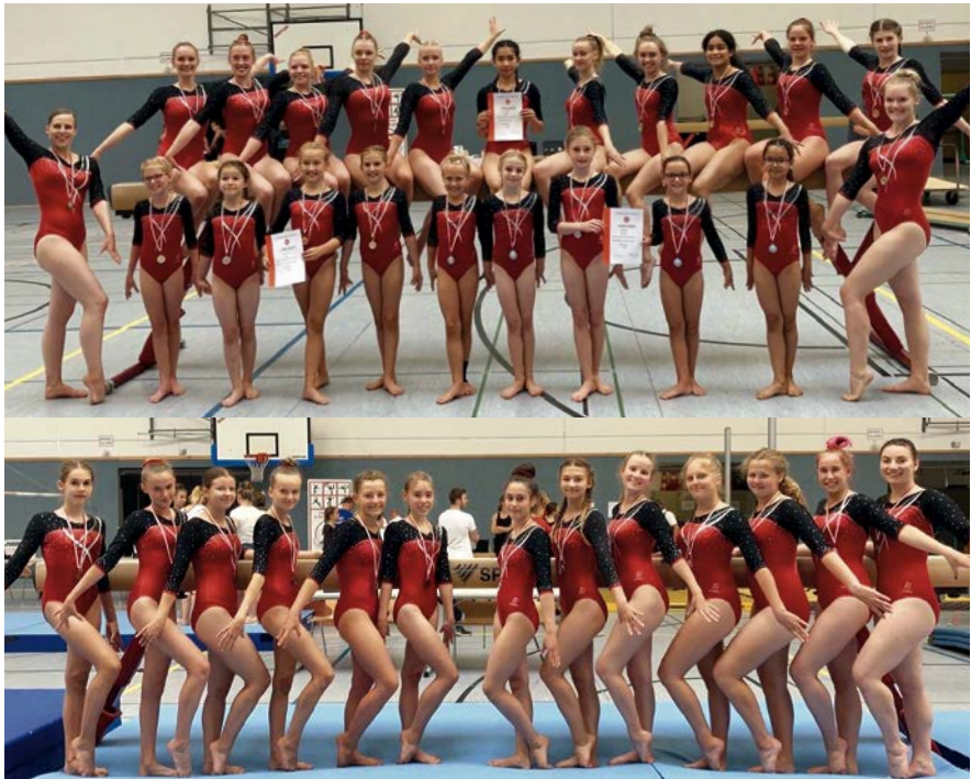
Die LK-Mannschaften sicherten sich alle eine Treppchenplatzierung