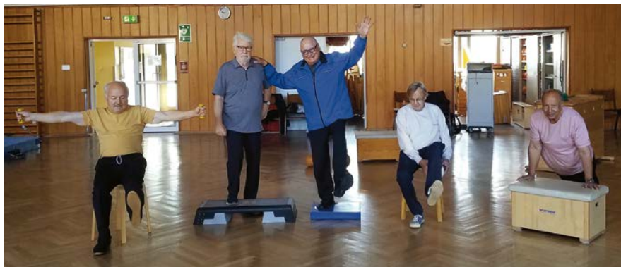
Sport bei Diabetes

Ganz neu im Programm sind seit September die Angebote zur Selbstverteidigung für Jugendliche und Erwachsene. Hier erlernen die Teilnehmer:innen wie sie sich in Gefahrensituationen selbstverteidigen können und so sicherer und selbstbewusster durch den Alltag kommen.