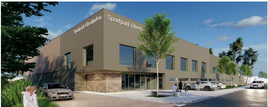
Eingangsbereich Berliner Allee