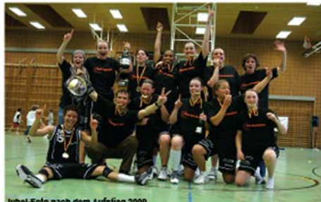
Jubiläum-Foto nach dem Aufstieg 2009