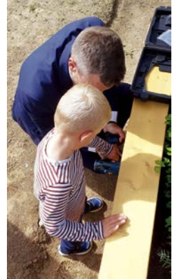
...und nimmt die Sache dann selbst in die Hand