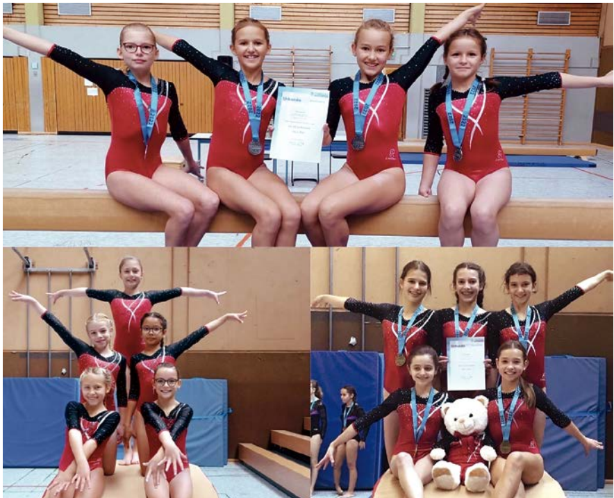
Alle drei Mannschaften schaffen die Quali zu den Hessischen