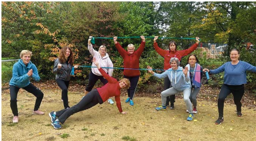
Fitness am Mittwoch

Mit mehr als 30 Angeboten in der Woche bietet der TV 1862 Langen e. V. seinen Mitgliedern und allen Interessierten ein umfassendes und abwechslungsreiches Fitness- und Gesundheitsangebot für verschiedene Zielgruppen.