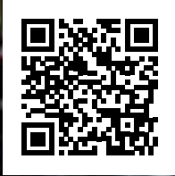
Aus dem Strahlemann-Kalender 2021