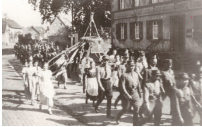
Ein Bild aus vergangenen Tagen – Aufmarsch der Nationalsozialisten in Gundernhausen.

Gundernhausen. In der Reihe „Chronik Gundernhausen“ ist das 30. Heft erschienen: Im Fokus: Warum konnte die NSDAP in Gundernhausen so schnell an die Macht kommen? Zu diesen und weiteren Fragen gibt das Heft Auskunft.