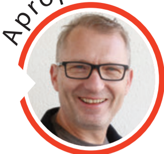
von Volker Zaborowski, Chefredakteur