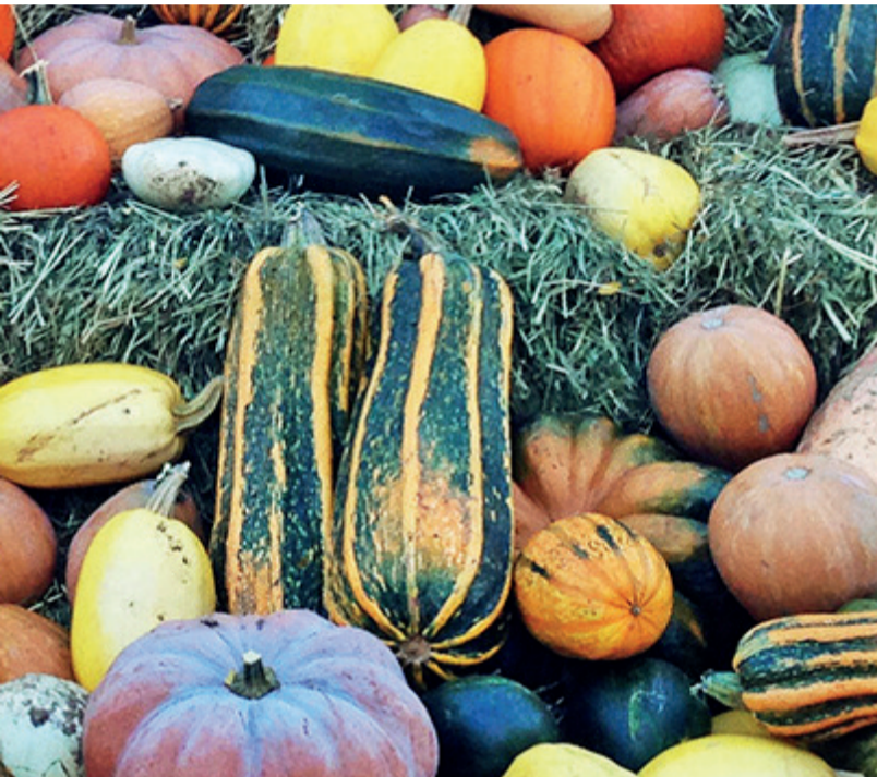
Schmackhaft und natürlich vielfältig – Kürbisse auf dem Kürbismarkt in Groß-Zimmern.

Groß-Zimmern. Nicht nur ein kleines Fest für die bekannten orangenen Früchte, sondern einen ausgewachsenen Markt bietet die Stadt Groß-Zimmern am Samstag, 8. Oktober und Sonntag, 9. Oktober, auf. Nach dem Erfolg im letzten Jahr wird nun nachgelegt und ein buntes Programm erstellt. Die Besucher können wieder über den Markt schlendern und den Anblick des frühen Herbstes auf den beiden Plätzen des Rathauses genießen, oder sie schauen sich in der Mehrzweckhalle um. Die Vielzahl an Kürbissen ermöglicht eine erstaunliche Bandbreite an verschiedenen Geschmacksrichtungen und Kochkreationen – Abenteuerlustige können mit einem gekauften Mitbringsel vielleicht sogar einen Kürbispudding zu Stande bringen. Aber es geht nicht nur um den Kauf, es geht auch um das Erlebnis: So tritt eine Volkstanzgruppe aus Nordmazedonien, Kriva Palanka, an mehreren Tagen auf, und auch die Heringer Sternsinger lassen ihre Stimmen erschallen. Für weitere Unterhaltung sorgt DJ Musik oder auch die Stelzenläuferinnen mit ihrem geplanten Auftritt. Weil diese nicht mit ihrem Wissen geizen, gibt es zusätzlich für Interessierte einen Workshop, bei dem sich die mit Standfestigkeit selbst in die luftigen Höhen begeben können