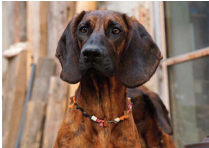
Hannoverscher Schweißhund