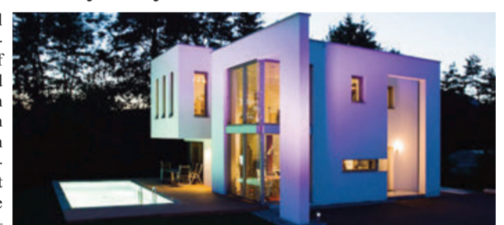
Das Flachdach steht heute vielfach wieder als Synonym für modernes Bauen.

Seit dem Bauhausstil ist das typische Flachdach ein Synonym für modernes Bauen. Grund für diese Entwicklung ist nicht nur die Ästhetik, es gab auch praktische Gründe. Da knapp 30 Prozent der Raumwärme über die Dachfläche verloren geht, sollte man diese so weit wie möglich verkleinern. Heute werden Flachdächer zunehmend auch als Dachterrasse oder als Gründach genutzt, sie sorgen damit für Lebensqualität und positive Klimawirkungen.