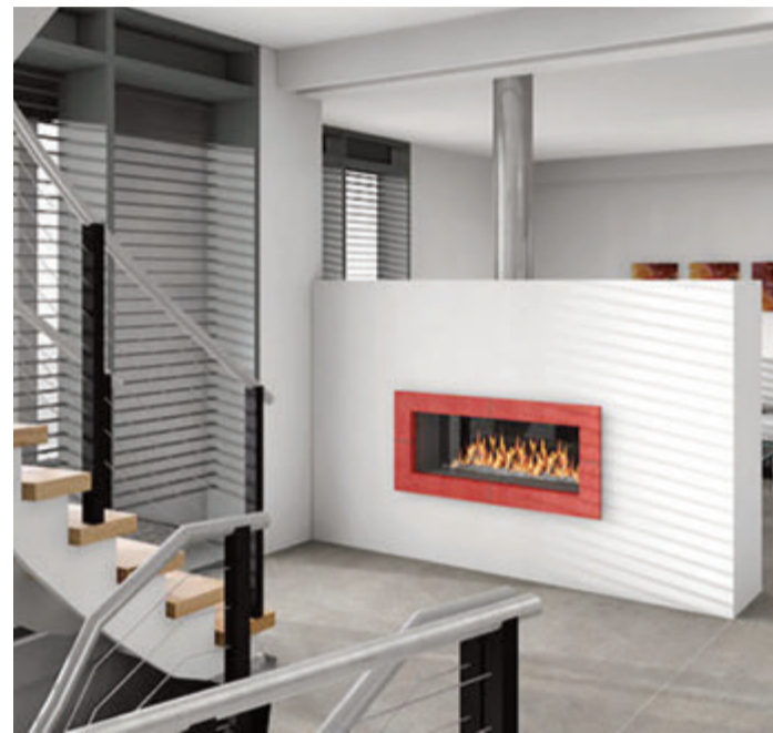
Moderne Gasfeuerstätten sind heute in vielen Design-Varianten und Breiten erhältlich.

In Deutschland werden Gaskachelöfen, Gaskamine und Gaskaminöfen immer beliebter. Für alle, die wenig Zeit haben, nicht mit Holz heizen wollen oder durch Vorschriften nicht mit Holz heizen dürfen, sind Gasfeuerstätten eine gute Alternative. Sie bieten einen sauberen Betrieb, Flexibilität und Wärmekomfort an.