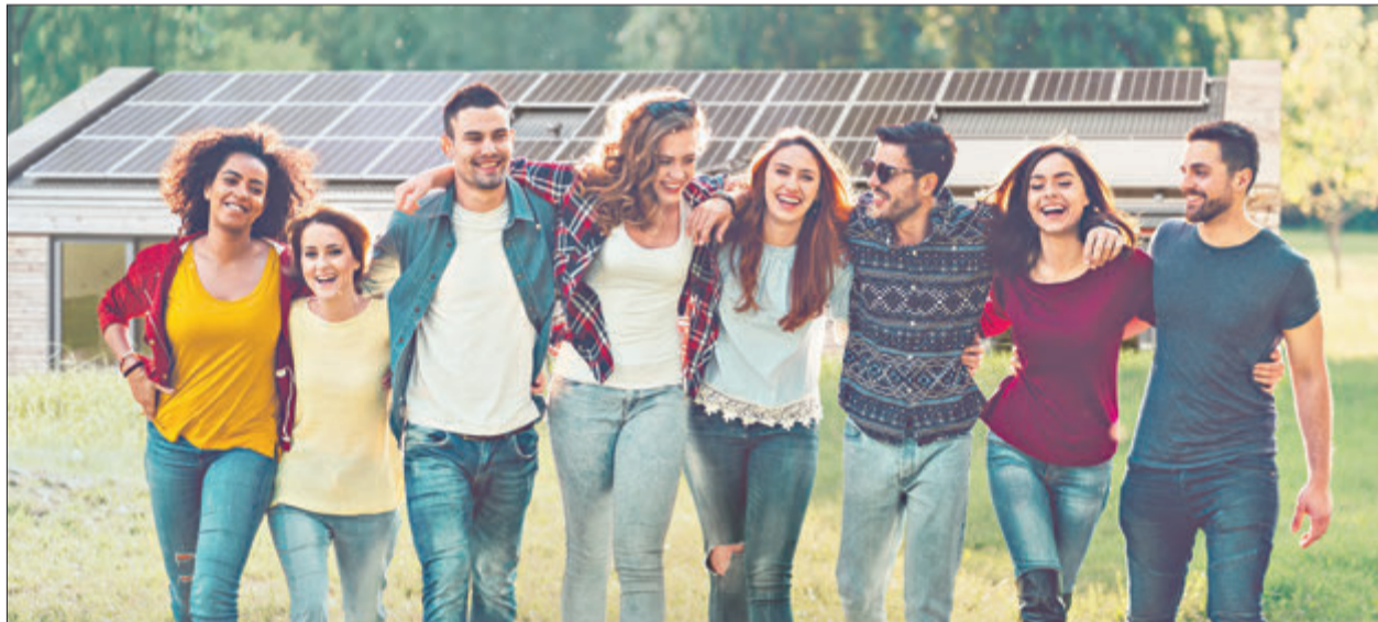
Unter dem Motto „Stark im Verein, stark fürs Klima“ unterstreicht ENTEGA, dass der Beitrag von Vereinen zum Klimaschutz wichtig und unverzichtbar ist.

Die Vereinsaktion der ENTEGA für Klima- und Umweltschutz