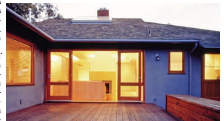
„Festbeleuchtung“. Licht sollte man nur dann nutzen, wenn man es auch wirklich braucht.