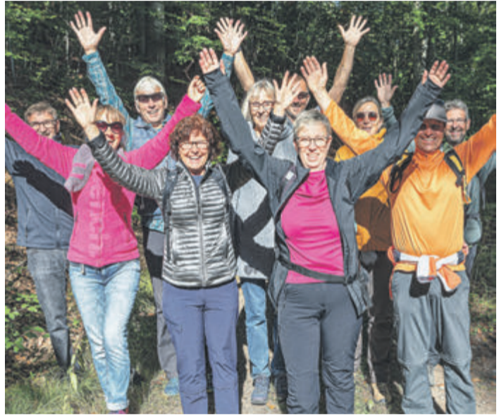
Crumbacher Wanderer und Wanderinnen erfreuen sich des Lebens beim Wandertag. Text/Foto: Dieter Preuss

Alles kann einfach über das Smartphone aktiviert werden. Zum Ausklang des Wandertages lohnt noch ein Besuch in einem der Crumbacher Gasthöfe.