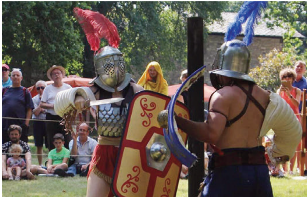
Schaukampf in originalgetreuer Ausrüstung.

Vortrag zum Anfassen über Arenenkampf bei den Römern