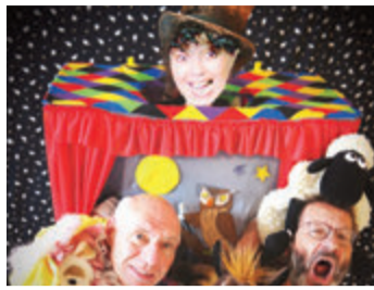
Nicht müde, sondern quicklebend sind die Darsteller der Tatüte.

Groß-Zimmern. Ein Musical für Kinder ab vier Jahren gibt es am Sonntag, 13. November, um 11 Uhr im Kulturzentrum „Glöckelchen“. Unter dem Titel „Trara, Tamtam und Tirili – Tolle Töne aus der Tüte“ treten drei Schauspieler an, um Lieder von Wackelzähnen und Wackeldackeln, von Meckermamas und Flattermäusen ebenso wie heitere und lehrreiche Geschichten vorzutragen und die Kinder zum Mitwatscheln mit dem Hasen Pinguin und dem vanilleeissüchtigen Eisbären zu motivieren. Auch der Winterschlaf und die Kälte kommen im Stück vor. Einlass ist ab 10.30 Uhr bei freier Platzwahl, der Eintritt kostet 6 Euro. Mehr Informationen bei den Veranstaltern unter Tel.: 06164-913871 oder per Mail: theaterausdertuete@gmx.de red