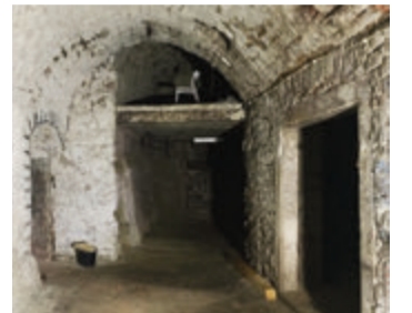
Michelstadt unterirdisch.