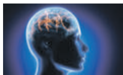
Die Deutsche Migräne- und Kopfschmerzgesellschaft e.V. (DMKG) geht von „350 000 Migräneanfällen täglich“ aus. 3

Für die Migräne-Prophylaxe gibt es bereits eine Reihe von verschreibungspflichtigen Medikamenten wie z.B. Beta-Blocker. Zwei Studien 1,2 zeigen: Der Mineralstoff Magnesium kann eine nicht verschreibungspflichtige, nebenwirkungsarme Alternative sein!