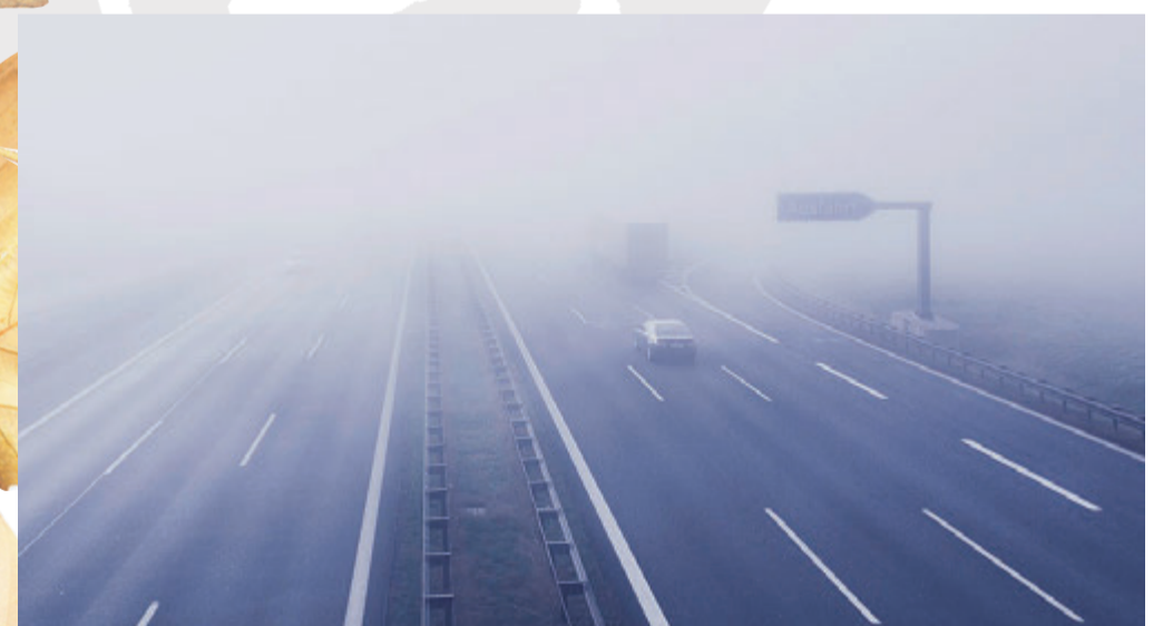
Nebel auf der Autobahn und feuchter Untergrund können gefährlich werden.

Ein großer Faktor der Kaufentscheidung sind die geringen Unterhaltskosten des neuen Taigo: Seine Versicherungseinstufungen sind günstig (Haftpflicht-Klasse: 12, Vollkasko: 18, Teilkasko: 17), und die Kfz-Steuer liegt mit 46 Euro im Jahr auf einem sehr niedrigen Niveau.