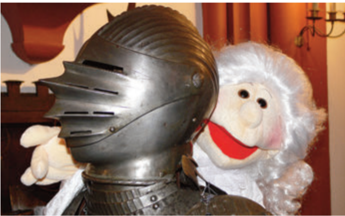
Reichlich Programm bietet die Betriebsgesellschaft Schloss Erbach in den Herbstferien für Kinder und Jugendliche.