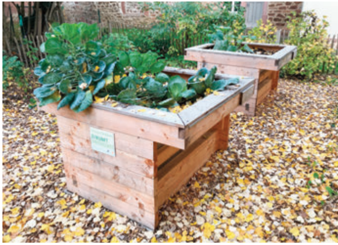
Die neuen Hochbeete sind mit Rollstühlen unterfahrbar und können im Sitzen bearbeitet und genutzt werden.

Michelstadt. Zwei neue Hochbeete ergänzen seit Kurzem die zehnte bestehende. Besonderes Merkmal der Beete im Gartenbereich neben der Passage in Richtung Großparkplatz Altstadt: Sie sind mit Rollstühlen unterfahrbar. Die neuen Hochbeete gehen auf eine Initiative der CittaSlow-Gruppe zurück und wurden vom Bauhof der Stadt Michelstadt ab März erstellt, platziert und für eine Erstbepflanzung vorbereitet. Die anfallenden Kosten von insgesamt 6.825 Euro wurden dabei im Rahmen des Förderprogramms „Zukunft Innenstadt“ des Landes Hessen mit 87,5 Prozent bezuschusst. Die Hochbeete können für 30 Euro pro Jahr von Bürgern mit Behinderung gepachtet und für den Eigenbedarf genutzt werden. Interessierte wenden sich per Email (hochbeet@michelstadt.de) oder per Tel.: 06061-74134 an die Stadtverwaltung, und zwar montags bis donnerstags von 9 bis 13 Uhr. red