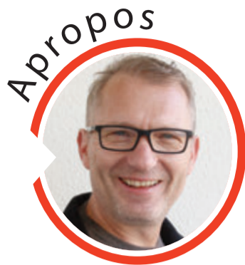
von Volker Zaborowski, Chefredakteur