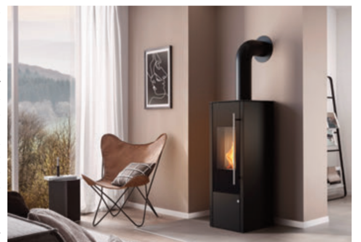
Gemütlichkeit und Wärme