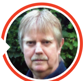
von Dr. Detlef Eichberg