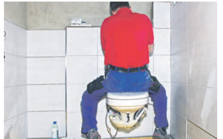
Die Neugestaltung eines Bades in Erbach für einen Kunden mit einer körperlichen Beeinträchtigung. Text/Bild: Dieter Preuss

einträchtigung. Leser und Leserinnen, die mehr wissen möchten informieren sich über www.ideal-bad.de oder rufen einfach an: 06161 512. red