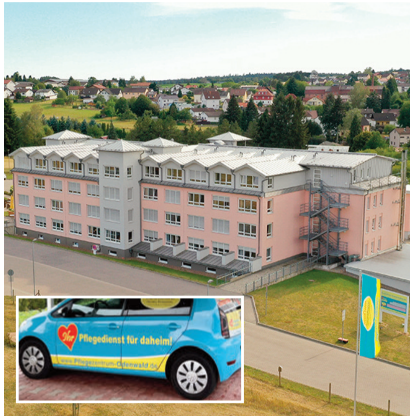
Keine Masken mehr für Bewohner in Gemeinschaftsräumen von Pflege- und Alteinrichtungen als auch 10 Millionen Euro Soforthilfe sorgen für Diskussionen.