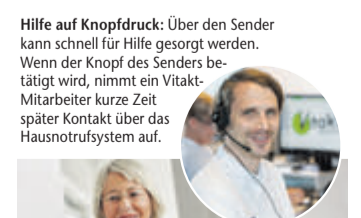
Hilfe auf Knopfdruck: Über den Sender kann schnell Hilfe gesorgt werden. Wenn der Knopf des Senders betätigt wird, nimmt ein Vitakt-Mitarbeiter kurze Zeit später Kontakt über das Hausnotrufsystem auf.