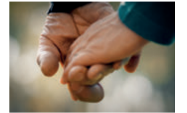
Eine Information der AstraZeneca GmbH. DE50489

Weitere Informationen unter: www.mehr-schutz.de