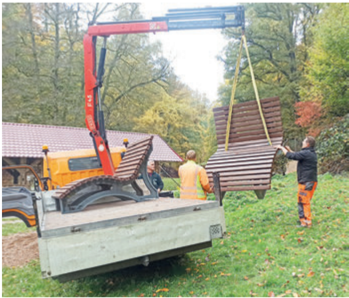
Die städtischen Bauhofmitarbeiter stellen neue Erholungsliegen im Wildpark Brudergrund auf.

aus Spenden der Schmitt-Lynker-Stiftung sowie den Einnahmen des Futtermittelverkaufs finanziert. In Zukunft sollen noch eine große Spielkombination zum Klettern und Rutschen und ein bodengleiches Trampolin folgen. Ebenso sind eine kleine Spielkombination und eine Nestschaukel vorgesehen. Der Eintritt zum Wildpark Brudergrund ist frei, Futterpäckchen kosten einen Euro. Auch Spenden werden genommen. red