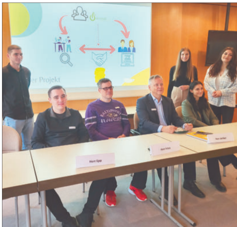
Bei der Gruppenveranstaltung für Schülerinnen und Schüler informierten Mitarbeitende des Kommunalen Job-Centers über ihre Aufgaben und standen den Teilnehmenden bei Fragen zur Verfügung.

„Viele unserer jungen Kundinnen und Kunden haben bereits konkrete Vorstellungen, was sie nach dem Schulabschluss machen möchten. Ein Großteil strebt ein Studium an. Es gibt aber auch Schülerinnen und Schüler, die noch unschlüssig sind. Diese haben meistens nur die gängigen Berufsbilder vor Augen. Wie vielfältig jedoch der Ausbildungsmarkt ist und welche Alternativen es beispielsweise gibt, wenn der Ausbildungswunsch mit dem vorliegenden Notenschnitt nicht realisierbar ist, wissen nur wenige. Deshalb haben wir in den Gesprächen auch die Zeit genutzt, um gemeinsam mit den Jugendlichen spezielle Informationsportale im Internet anzuschauen