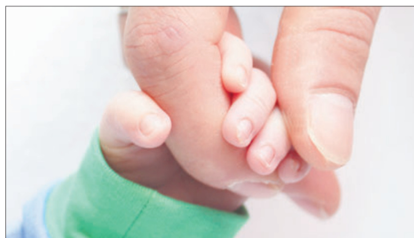
Sichere Bindung zwischen Eltern und Kind.

Das größte Geschenk für die gesunde Entwicklung eines Kindes