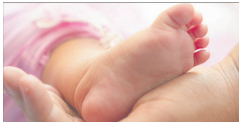
Babymassage-Kurs in der Elternakademie am Gesundheitszentrum Odenwaldkreis.

Erbach. Der nächste Babymassage-Kurs in der Elternakademie am Gesundheitszentrum Odenwaldkreis (GZO) findet von 23.11. bis 14.12., jeweils mittwochs von 10 bis 11 Uhr, statt. Es sind noch Plätze frei – Eltern können sich mit ihrem Baby ab der sechsten Lebenswoche anmelden und erlernen an den vier Kursterminen geeignete Massagetechniken für ihr Neugeborenes.