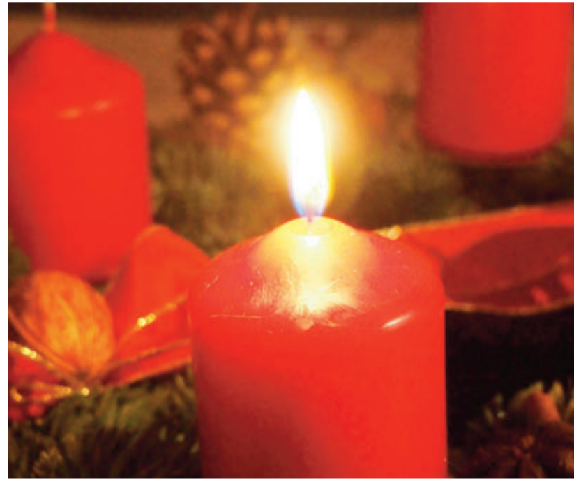
Das erste Licht auf dem Adventskranz wird an diesem Sonntag entzündet, von nun an dauert es nicht mehr lange bis Weihnachten.

Odenwaldkreis. Mit diesem Wochenende beginnt nun die Adventszeit, am Sonntag ist bereits der erste Advent. Damit beginnt eine der größten Traditionen in unserem Kulturkreis, die Feier der Ankunft von Jesus Christus. Die ganz spezielle Stimmung in dieser Zeit hat sich jedoch vom christlichen Hintergrund abgelöst. Nun steht die festliche Stimmung im Vordergrund, das Nahen der Geschenkezeit, die alljährliche Frage, ob es eine „weiße“ Weihnacht gibt. Wie in der letzten Ausgabe berichtet, gibt es auch eine Vielzahl an vorweihnachtlichen Veranstaltungen im Odenwaldkreis, die sich mit Kindern oder auch ohne besuchen lassen.