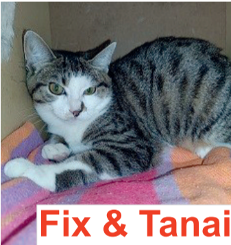
Fix & Tanai

Fix & Tanai , ein Geschwisterpärchen, hatten bisher kaum menschlichen Kontakt und müssen erst Vertrauen lernen. Ideal wäre für die fünf Monate alten, kastrierten und geimpften Tiere katzenereifere Menschen oder ein landwirtschaftliches Anwesen mit einem warmen Plätzchen und täglicher Versorgung, wo Fix und Tanai nach der Eingewöhnung wieder ein freies Katzenleben führen dürfen. Spätere Dankbarkeit und Zuneigung von Seiten der Katzenkinder ist keinesfalls ausgeschlossen.