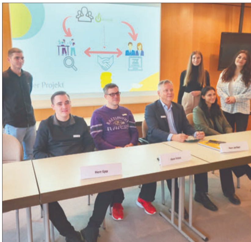
Bei der Gruppenveranstaltung für Schülerinnen und Schüler informierten Mitarbeitende des Kommunalen Job-Centers über ihre Aufgaben und standen den Teilnehmenden bei Fragen zur Verfügung.

„Viele unserer jungen Kundinnen und Kunden haben bereits konkrete Vorstellungen, was sie nach dem Schulabschluss machen möchten. Ein Großteil strebt ein Studium an. Es gibt aber auch Schülerinnen und Schüler, die noch unschlüssig sind. Diese haben meistens nur die gängigen Berufsbilder vor Augen. Wie vielfältig jedoch der Ausbildungsmarkt ist und welche Alternativen es beispielsweise gibt, wenn der Ausbildungswunsch mit dem vorliegenden Notenschnitt nicht realisierbar ist, wissen nur wenige. Deshalb haben wir in den Gesprächen auch die Zeit genutzt, um gemeinsam mit den Jugendlichen spezielle Informationsportale im Internet anzuschauen