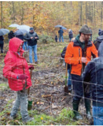
Trotz schlechten Wetters war die Baumpflanzaktion gut besucht.