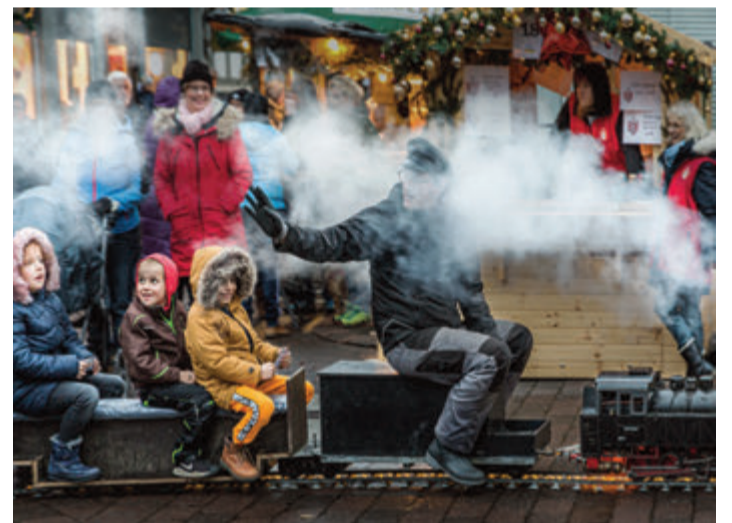
Mit einer echten Miniatur Dampflok treten die Kleinen eine große Reise an

Ihr Kinderlein kommet , oh Herzen höherschlagen. Unsere Kleindampfbahn mitten auf dem Marktgelände versetzt euch Mädels und Buben in einen Geschwindigkeitsrausch. Die süßen Sachen all überal machen besonders froh. Und der Benznickel am Sonntag-nachmittag – klar doch! – so viele!