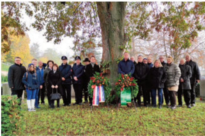
Gedenken an die Gefallenen der Kriege.