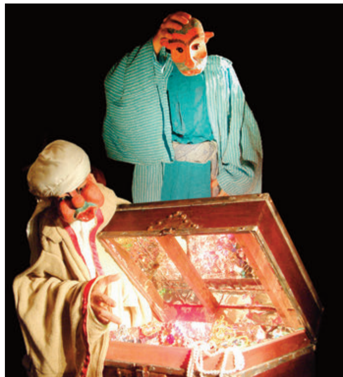
Da darf sich die Puppe schon mal am Kopf kratzen.

Groß-Umstadt. Das Ensemble 1001 Nacht. Gespielt wird in einer „Theater en Miniature“ präsentiert Mischung aus Schauspiel und ver-