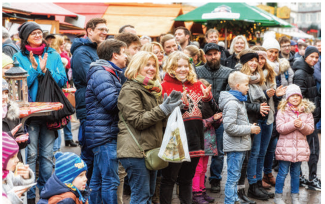
Die pure Freude an unserer Bühne