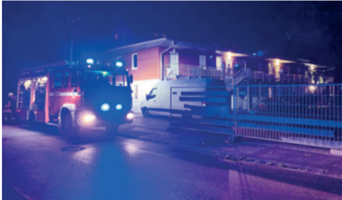
Die Feuerwehr vor Ort.