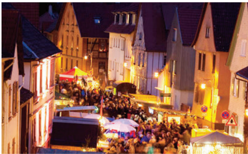
Wie eine große, golden leuchtende Kerze sieht der Baum in Reinheim aus (oben). Die „Flaniermeile“ Ueberaus soll am 11. Dezember so aussehen (unten).