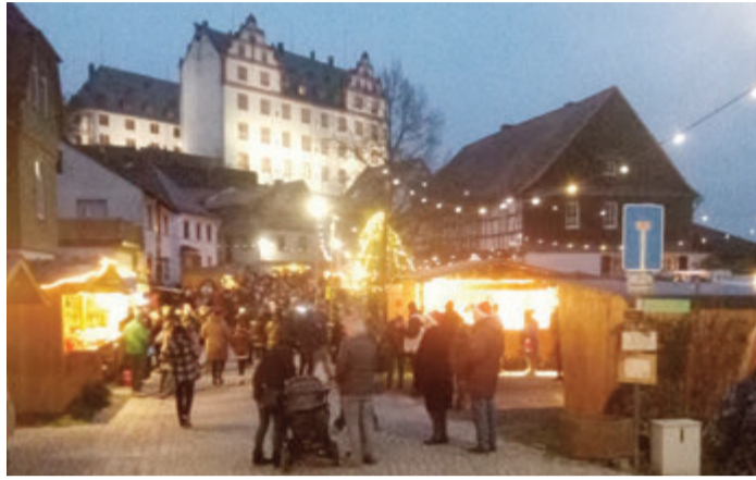
Schon der Eingangsbereich ist erfüllt vom goldenen Licht der Weihnachtsfestivitäten, darüber thront das Schloss.