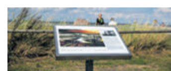
Dangaster Kunstpfad: 21 Bildtafeln mit Reproduktionen an Originalschauplätzen.

Watt? Erholung! – Urlaub mit Genuss-Garantie: Entspannung und Kultur im Nordseebad Dangast (epr) Dangast bildet den südlichen Eingang zum Weltnaturerbe Wattenmeer und blickt auf eine über 200-jährige Geschichte als Seebad zurück. Heute finden große und kleine Gäste hier alles, was einen tollen Urlaub ausmacht: Bei Flut lädt das flache Wasser vor der Küste zum Schwimmen und Planschen ein, in den bunten Strandkörben sonnen sich die Eltern, während der Nachwuchs eifrig Sandburgen baut. Bei Ebbe bieten sich ganz andere, nicht weniger aufregende Möglichkeiten: Die einzigartige Naturlandschaft des Wattenmeers steckt voller Leben, das sich am besten bei einer geführten Wattwanderung erleben lässt. Dangast punktet zudem mit einem besonderen Kunst- und Kulturprogramm. Galerien, Ateliers und das Künstlerhaus Franz Radziwill ziehen ebenso die Blicke auf sich wie beeindruckende Kunstwerke und Skulpturen aus Stein und Metall, die im gesamten Ort zu sehen sind. Mehr unter www.reiseplaza.de/dangast