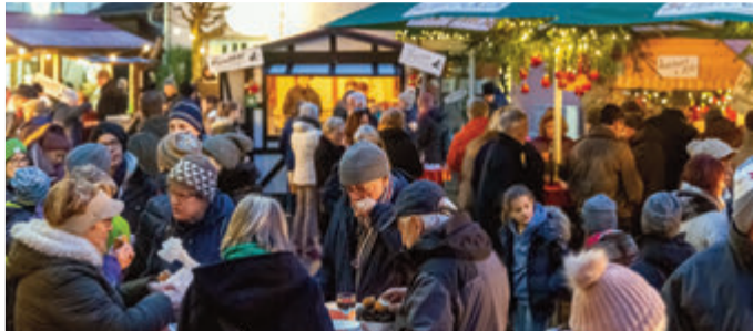
Genussweihnachtsmarkt in Crumbach Seite 13-16

Bundesweiter Warntag: Großer Test der Frühwarnsysteme Seite 3 Bauen & Wohnen: Energiesparen leicht gemacht Seite 6