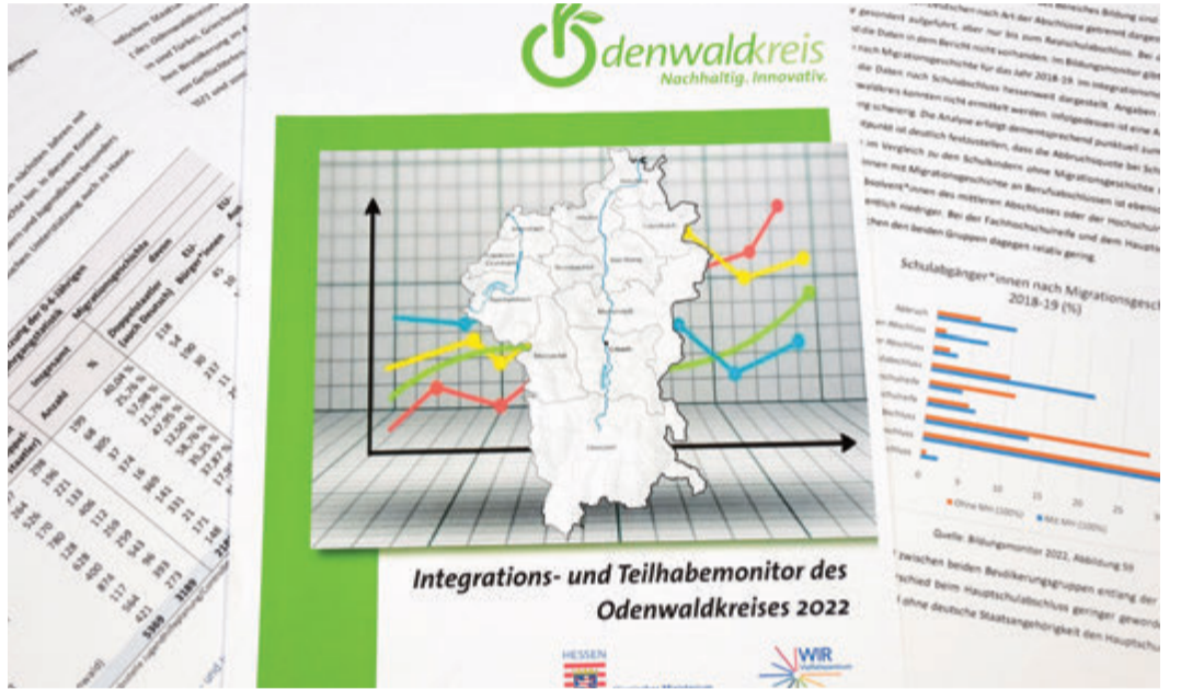
Aufschlussreich: Der neue Integrationsmonitor enthält auf 90 Seiten viele interessante Informationen, die auch in Tabellen oder als Grafiken aufbereitet sind.

Dabei hat der Monitor die unterschiedliche Situation im Odenwaldkreis im Blick. Während 2020 in Fränkisch-Crumbach lediglich 4,3 Prozent der Bevölkerung ausländische Staatsangehörige waren, machten sie in Erbach 17,4 Prozent und in Breunberg 23,4 Prozent aus (im Vergleich: Hamburg liegt bei 16,8, Berlin 19,6 und Wiesbaden 21,9 Prozent). red