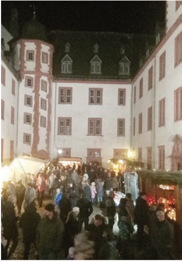
Der Schlosshof bietet die passende Kulisse für die festlichen Stände.

Der Lichtenberger Adventsmarkt gibt einen Vorgeschmack auf das große Fest