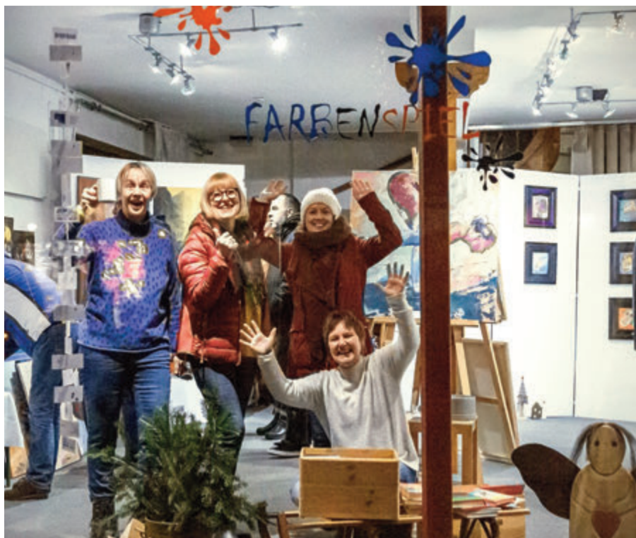
Die Mädels der Künstlerinnen-Gruppe „Farbenspiel“ freuen sich auf ihre kunstsinnigen Gäste

Mitten im Dorf , somit auch einem einzigartigen Farbenspiel, um eine Wand damit zu schmücken, oder auf der Suche nach einem wundervollen Weihnachtsgeschenk ist, der Freude. Ausgestellt und zum Erwerb angeboten werden fantastische Bilder der Künstlerinnen-Gruppe „Farbenspiel“. Sie ist während des gesamten Weihnachtsmarktes geöffnet.