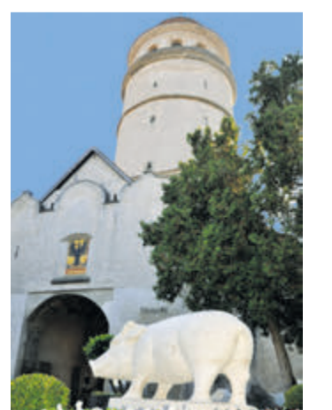
Interessante Einblicke in die Geschichte Nördlingens gibt es auch im Stadtmuseum im Löpsinger Torturm.

Wie ein Schwein die Stadt gerettet haben soll – Spannende Geschichten rund um Nördlingen locken Besucher an (epr) Die ehemals Freie Reichsstadt Nördlingen hat einiges zu bieten: Neben interessanten Museen wie dem Bayerischen Eisenbahnmuseum und dem Rieskratermuseum gibt es den Geopark Ries, in dem man viel über den Meteoriteneinschlag vor 14,5 Mio. Jahren erfahren kann. Wer gerne noch tiefer in die Stadtgeschichte blicken möchte, reserviert sich eine 1,5-stündige Führung auf der Stadtmauer, die einzige rundum begehbbare in ganz Deutschland. Vielleicht hört man hier auch davon, wie eine Sau die Stadt Nördlingen 1440 angeblich vor einem Überfall gerettet hat. Weitere Informationen unter www.reiseplaza.de/noerdlingen