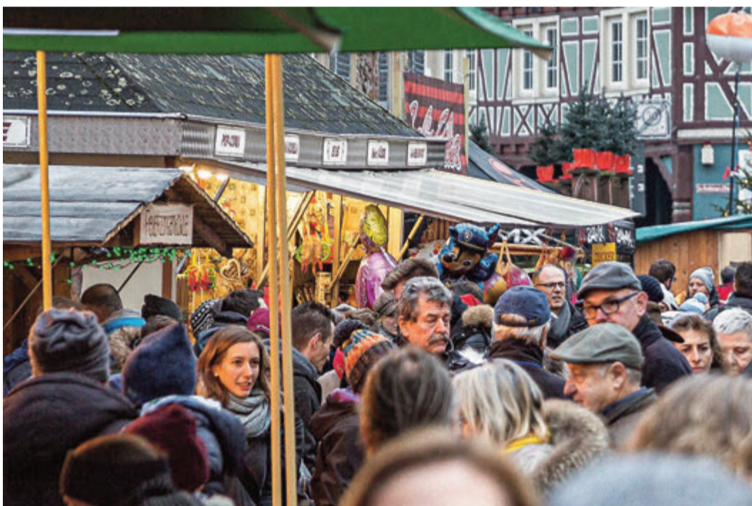
Die Odenwälder Dorfweihnacht freut sich auf ihre großen und kleinen Gäste

Geöffnet ist die Odenwälder Dorfweihnacht am Samstag, 10. 12., ab 15 Uhr und am Sonntag, 11.12., ab 12 Uhr. Die amtliche Eröffnung mit Posaunenchor, Bürgermeister, WVV-Vorsitzender und Pfarrer ist am Samstag um 16 Uhr an der