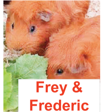
Frey & Frederic

Frey & Frederic , zwei kastrierte Meerschweinchen, sind gemeinsam auf der Suche nach einem neuen Abenteuer-spielplatz. Die einjährigen Böckchen brauchen ein abwechslungsreiches Innen-gehege zum Rennen, Klettern und Buddeln. Meerschweinchen sind tagaktive, putzige Nager, aber keine Schmuse- oder Kuschelknäule, sondern interessante Beobachtungstiere, die Zuwendung, Pflege und Beschäftigung benötigen.