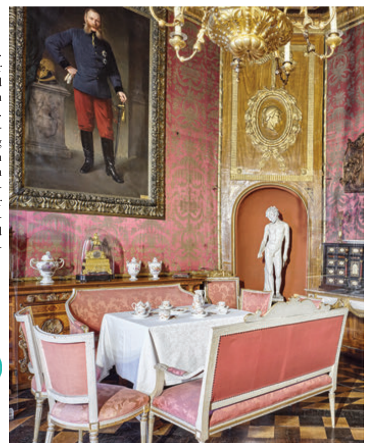
Kaffeetafel im Roten Salon