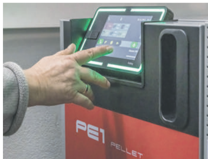
Ein moderner und komfortabler Pelletskessel mit niedrigen Emissionen, leisem Betrieb, hoher Energieeffizienz und geringem Stromverbrauch. Text/Bild: Dieter Preuss

(akz-o) In Deutschland sind etwa 4,1 Millionen Menschen pflegebedürftig. Die Zahlen des Statistischen Bundesamts belegen auch: Etwa 80 Prozent dieser Mitmenschen, die aufgrund gesundheitlicher Beeinträchtigungen dauerhafte Unterstützung benötigen, werden zu Hause versorgt. Dort rückt dann ein Rückzugsort besonders in den Fokus: das eigene Bad. „Ein selbstbestimmtes Leben lässt sich, solange dies möglich ist, am besten im gewohnten privaten Umfeld führen. Da die Lebenserwartung steigt, gewinnt die Pflege in den heimischen vier Wänden immer mehr an Bedeutung – und damit auch das eigene Bad, das pflegegerecht und barrierefrei konzipiert sein sollte“, sagt Markus Hahn, bundesweit verantwortlich für die Umsetzung des Elements-Kon- zepts, das in den bundesweit mehr als 260 Ausstellungshäusern präsentiert wird. In Deutschlands Wohnungen sind allerdings millionenfach Bäder vorzufinden, die nicht einmal eine Fläche von fünf oder sechs Quadratmeter aufweisen. Sie sind zu klein, um etwa einer benötigten Pflegekraft oder häuslichen Assistenz ausreichend Platz zu bieten, wenn die eigene alleinige Körperhygiene aufgrund motorischer Einschränkungen nicht mehr möglich ist. Die gute Nachricht: Auch für diese kleinen Grundrisse planen die Expertinnen und Experten pflegegerechte Lösungen, die nicht nur höchst funktional sind, sondern auch in puncto Komfort wie Design überzeugen und alle Sinne ansprechen – damit man sich zu Hause möglichst lange gut aufgehoben fühlt.