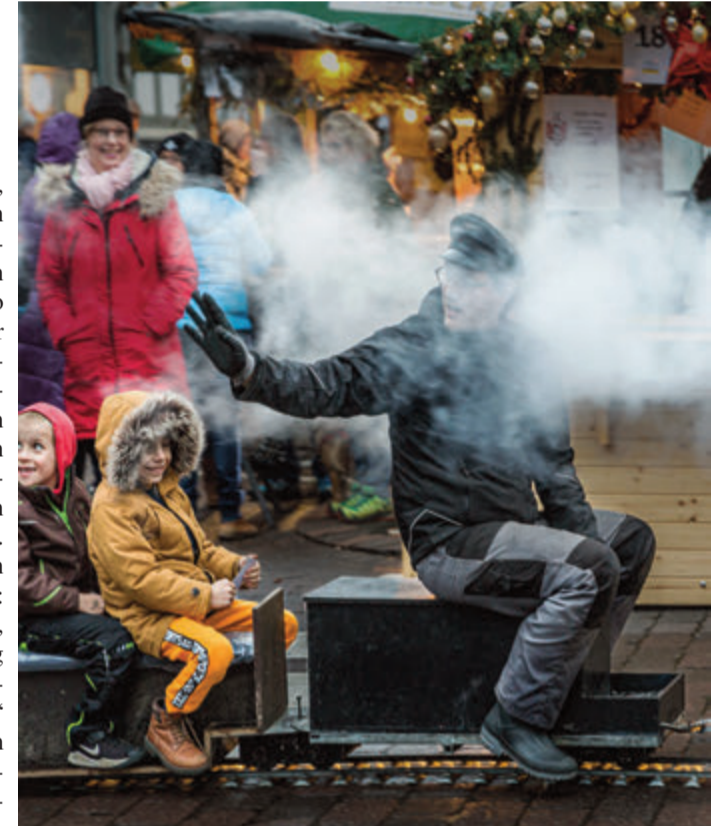
Große Reise für die Kleinen mit einer echten Miniatur-Dampflokomotive.

Fränkisch-Crumbach. Wenn das kein Grund zur Fröhlichkeit ist: Nach zwei weihnachtsmark-losen Pandemie-jahren erklingen am und um den 3. Advent in der Crumbacher Dorfmitte wieder die Posaunen. Aufgeflogen ist die Odenwälder Dorfweihnacht am Samstag, 10. 12., ab 15 Uhr und am Sonntag, 11. 12., ab 12 Uhr. Die amtliche Eröffnung mit Posaunenchor, Bürgermeister, VVV-Vorsitzender und Pfarrer ist am Samstag um 16 Uhr an der Bühne in der Mitte des Marktes. Am Sonntag ab 15 Uhr rumpeln der Benznickel und sein Knecht über den Markt und erfreuen die Kleinen mit Süßigkeiten und an-