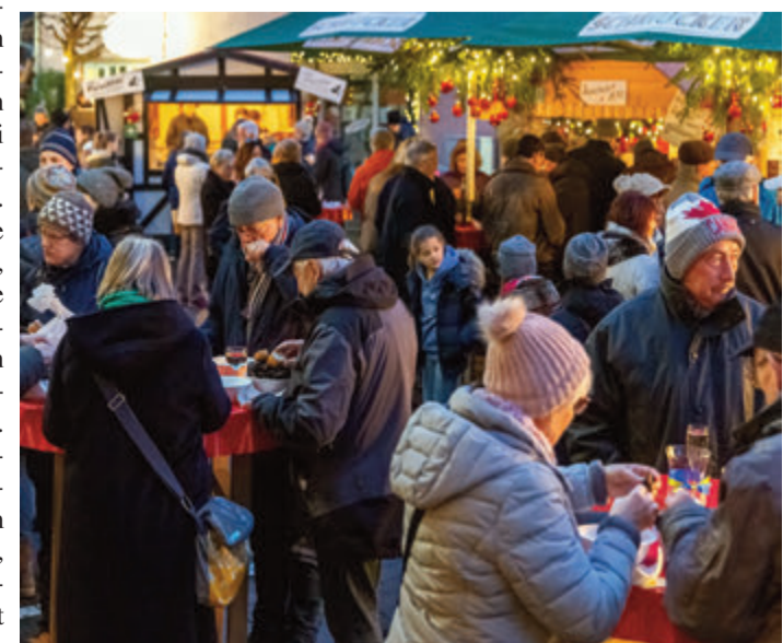
Viele Menschen aus Stadt und Land wissen die weihnachtlichen Dekoratoren sehr zu schätzen.

deren Geschenken. Reichlich be- lohnt werden die Buben und Mädchen, wenn sie auf der Bühne ein Lied anstimmen oder ein Gedicht aufsagen oder einfach eine fröhliche Geschichte erzählen. Nach dem Benznickel wird der Crumbacher Chor die Weih-nachtsmarkt-gäste mit fröhlichen und melodischen Weisen unterhalten. Die Gourmets unter den Gästen wird besonders freuen, dass es wieder Wildschweinbrat-wurst und Wildschinken von den „Crumbacher Wildlingen“ gibt. Und natürlich Austern, französischen Wein, viele Spezialitäten der Crumbacher Direktvermark-ter sowie den süßig-fruchtigen Crumbacher Glühwein. red