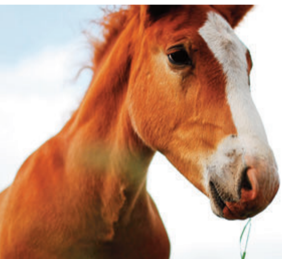
Bei den gequälten Tieren soll es sich um Pferde, möglicherweise auch um die anderen Tiere auf dem Anwesen, gehandelt haben. Foto: Symbolbild

Höchst. Einer Tierhalterin im Gemeindegebiet von Höchst wurden in der letzten Woche alle Tiere durch das Veterinäramt des Odenwaldkreises weggenommen, darunter auch einige Pferde. Darüber hinaus wurde ihr generell verboten, Tiere zu halten. Die Polizei war per Amtshilfe an dem Einsatz beteiligt. Bereits Mitte des Jahres hatte das Veterinäramt die Tierhalterin kontrolliert. Damals gab es allerdings keine Beweise, die ein Eingreifen gerechtfertigt hätten. Anlässlich der aktuellen Überprüfung gab es jedoch Beweise für Schläge und andere Mißhandlungen der Pferde, so laut einer Mitteilung des Odenwaldkreises. „Daraufhin haben wir schnell interveniert und eines der schärfsten uns zur Verfügung stehenden Mittel angewendet“, sagt der für das Veterinäramt zuständige Hauptabteilungsleiter Bernhard Hering. Damit das Veterinäramt schnell und wirksam gegen Tierquälerei vorgehen kann, sind Beweismittel unerlässlich. „Wir benötigen unbedingt Zeuginnen und Zeugen, die bereit sind, uns Vorgänge zu schildern oder die Beweismaterial vorlegen können“, so Abteilungsleiterin Jil Ebenig. Oft heiße es, die Behörde habe „alles schon lange gewusst“, aber tatsächlich gebe es keine verwertbaren Zeugen-