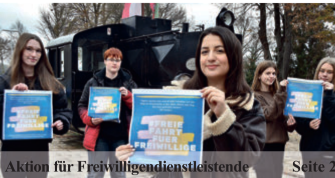
Aktion für Freiwilligendienstleistende Seite 2

Motorrad-Saison: Polizei Südhessen zieht Bilanz Seite 6