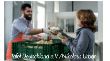
Tafel Deutschland e.V./Nikolaus Urban

Gäste musste schon ca. ein Drittel der Tafeln die weitere Aufnahme stoppen. Gleichzeitig haben die Tafeln selbst mit höheren Kosten zu kämpfen, wobei die Ausgaben für den Betrieb der Transporter sowie der Kühl- und Tiefkühl-Lager einen großen Faktor darstellen. Netto arbeitet seit 2007 mit den Tafeln zusammen. Neben regelmäßigen Spendenaktionen unterstützt der Lebensmittelhändler mit der Weitergabe noch haltbarer Lebensmittel.