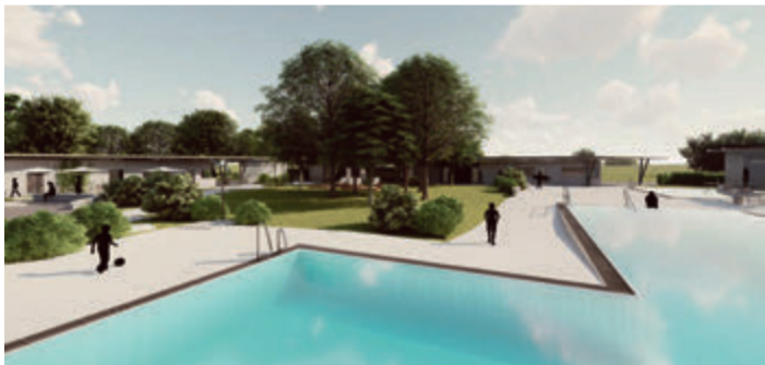
So soll das Schwimmbad aussehen.