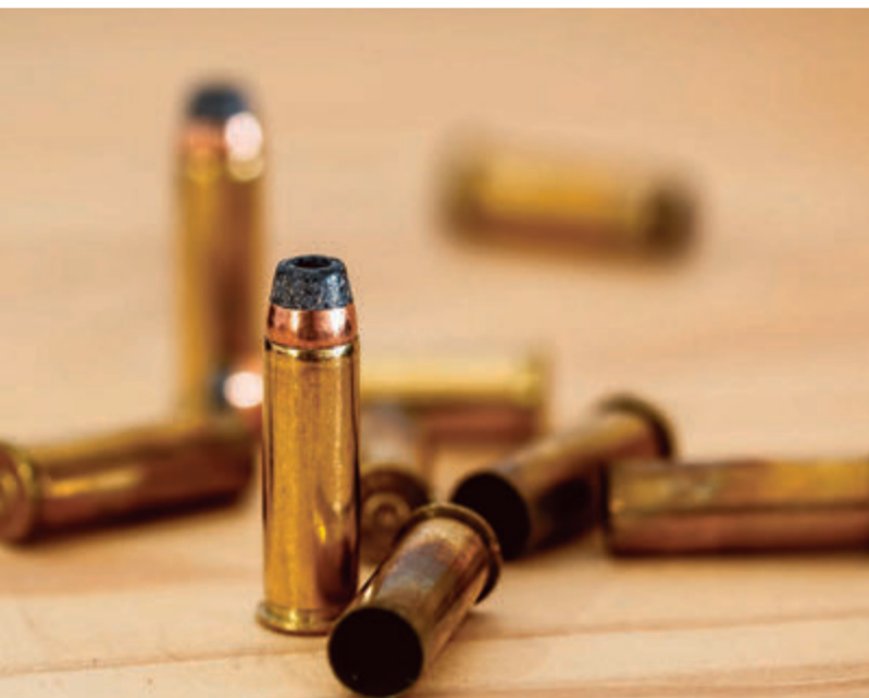
Zum Redaktionsschluss wurden die Funde der Durchsuchung in Groß-Zimmern noch ausgewertet. Foto: Symbolbild

In Groß-Zimmern wurden die Wohnräume eines 44 Jahre alten Mitbeschuldigten durchsucht. Hier wurde insbesondere nach gefälschten Pässen und sonstigen Ausweisdokumenten gesucht. Die Polizei Südhessen verweist auf Anfrage darauf, dass die Auswertung noch andauert. Die falschen Pässe wurden nach bisherigen Erkenntnissen zur illegalen Einreise oder dem illegalen Aufenthalt in der Europäischen Union und in Deutschland gesucht.