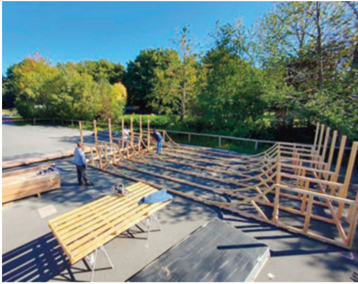
Miniramp im Bau

ten/ Longboard/ Scooter und BMX sollten Kommunen hierfür Räume zur Verfügung stellen und diese auch konsequent evaluieren sowie auf neue Entwicklungen und Bedürfnisse anpassen. Geschaffen wurde eine Rampe, die sowohl als Einstieg in diesen Sport zu nutzen ist, als auch von fortgeschrittenen Skatern, um ihr Können zu verbessern. Die Miniramp ist eine Sonderanfertigung - angepasst an die Gegebenheiten vor Ort. red