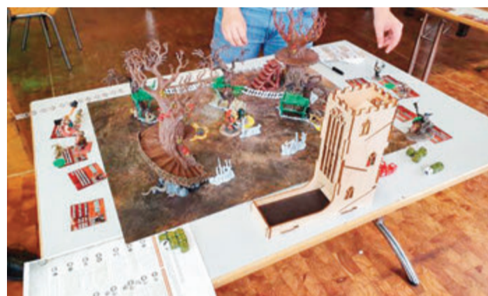
Ein Tabletop-Setting mit Baum.

Bei Tabletop Spielen wie Warhammer besteht das Spiel aus bombastischen Welten, die mit guten und bösen Archetypen arbeiten, Kooperation gemeinsames Vorgehen und das pragmatische Lösen von Konflikten sind unabdingbar für ein erfolgreiches Spielerlebnis. Anders als bei dem individuellen spielen von Computerspielen ist die psychische Distanz so groß, dass ein Risiko der Sucht oder zu starken Identifikation mit der Spielwelt nicht gegeben ist. Das eigentlich starke Element von Tabletop besteht aus dem realen Ort an dem man zusammenkommt, sich gegenseitig hilft und inspiriert und die erlebte Dramatik auf dem selbst gestalteten Spielfeld, mit direkter persönlicher Interaktion. Die Welt der Jugendlichen wird durch Tabletop entschleunigt, sie haben reale Mitspieler, die ihre Interessen teilen. red