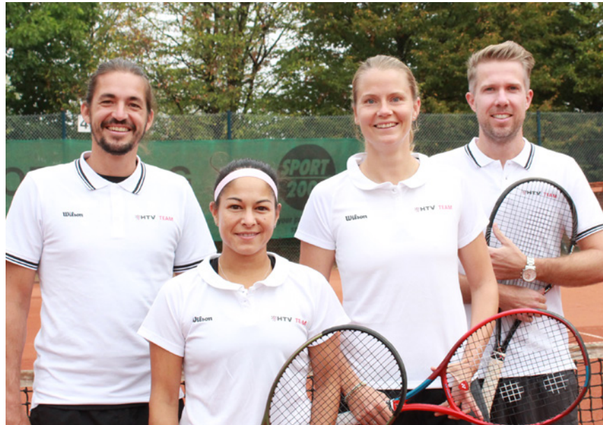
Team Hessen AK 40