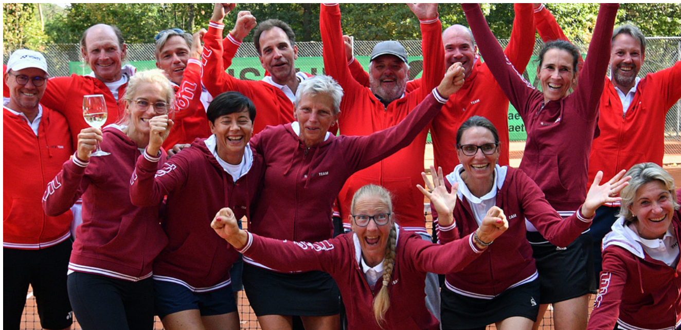
Team Hessen AK 50 – Deutscher Meister 2022

Der größte Erfolg aus hessischer Sicht gelang dem Team der Altersklasse 50, welches in heimischen Gefilden beim TC Bruchköbel die Endrunde austrug. Nachdem im Halbfinale am Samstag völlig überraschend die Mannschaft vom TV Niederrhein bereits nach den sechs gespielten Einzeln besiegt werden konnte, setzte das Team Hessen am Sonntag im Finale sogar noch einen drauf. Gegen die favorisierten Spielerinnen und Spieler vom Tennisverband aus Berlin und Brandenburg stand die Begegnung jedoch mehrmals auf Messers Schneide.