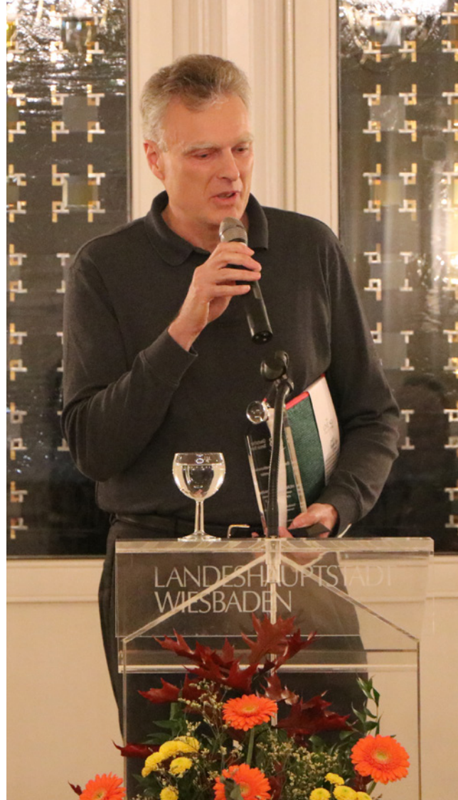
Auszeichnung zum besten internationalen Jugendturnier Deutschlands