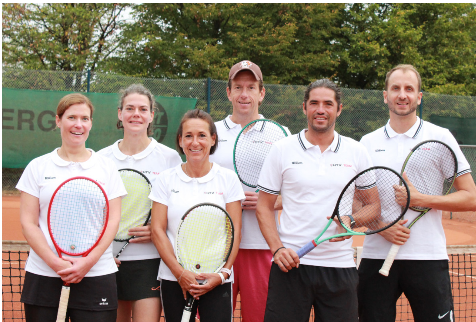
Team Hessen AK 30

Was sollen wir sagen? Besser ging es nicht. Bereits nach den Einzelnen stand es 3:1 für unsere Jüngsten, so dass der Aufstieg in die B(undes)-Liga schon vor dem abschließenden Mixed besiegelt war. Endstand 4:1 und Uffstiech! Ein ganz großes Danke für den sensationellen Einsatz, und wir freuen uns schon auf das nächste Jahr mit Euch.