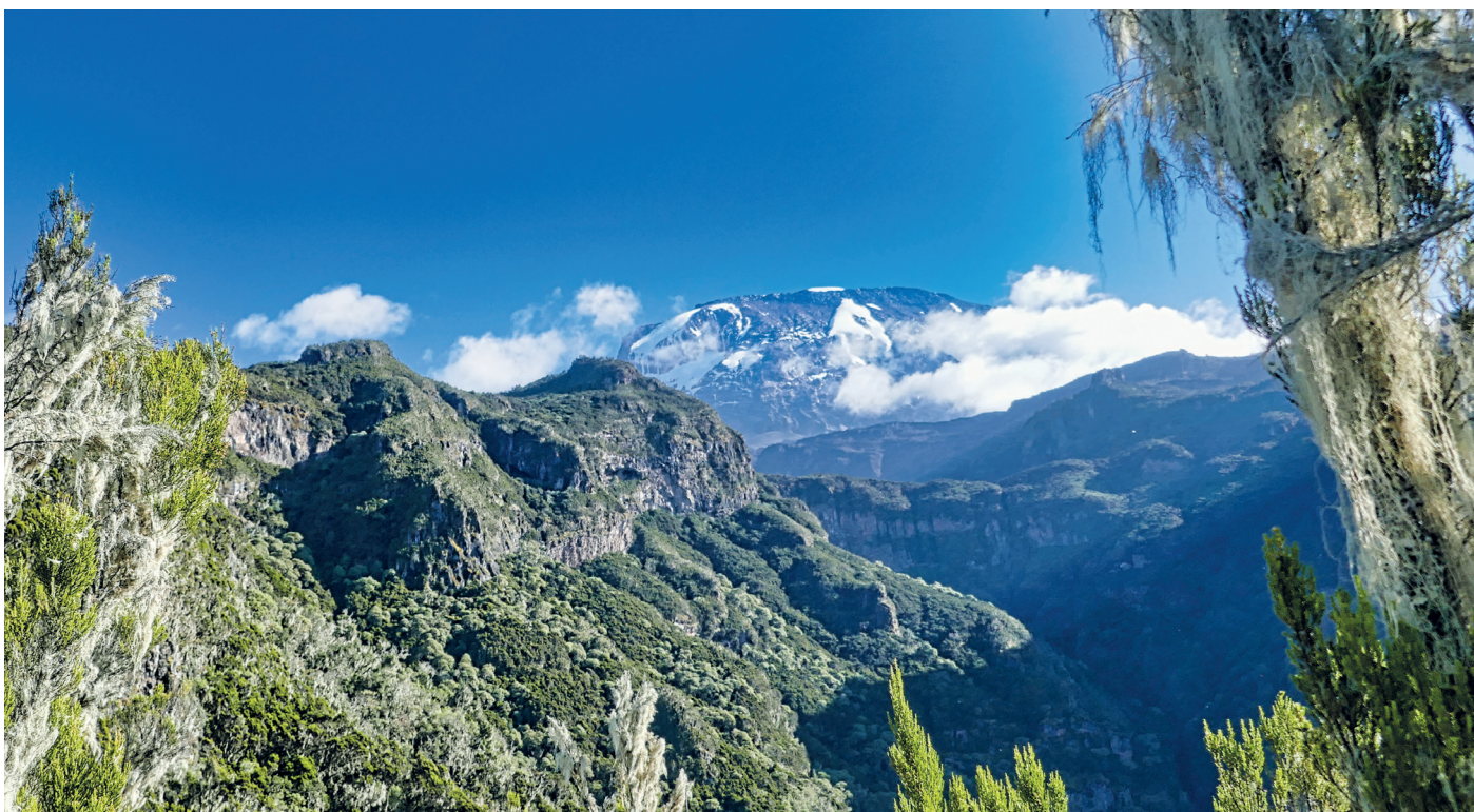
Der spektakuläre Umbwe-Kamm vor dem 5.895m hohen schneebedeckten Gipfel des Kilimanjaro.

Wiederholungstermin der neuen Live-Reportage von Stefan Seibold am Freitag, den 20. Januar 2023, um 20:00 Uhr im Bücherbahnhof Erzhausen