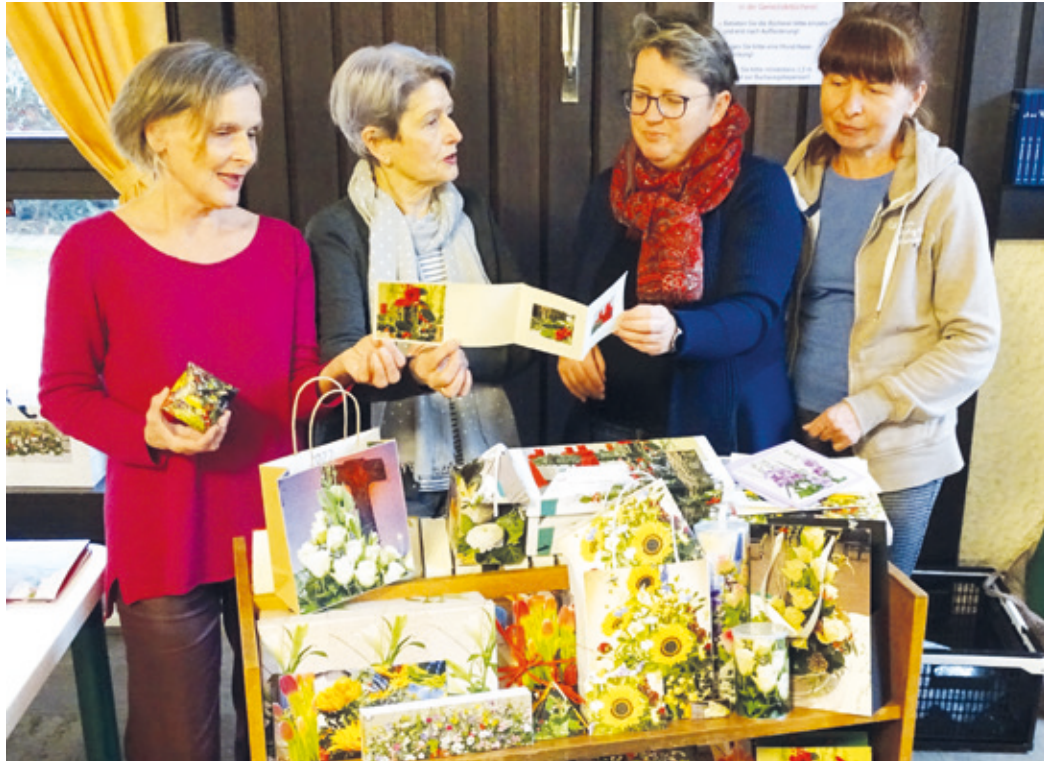
Das Foto zeigt einen Teil des Bastelteams im ÖGZ.

Als Begleiter für das neue Jahr 2023 gibt es den ganz druckfrischen Kranichsteiner-Kunst-Kalender 2023 mit 13 wunderschönen, bekannten aber teils auch weniger bekannten Wasserspektiven in Kranichstein noch überall zu kaufen heraus. Der Kalender wurde von der Kranich-