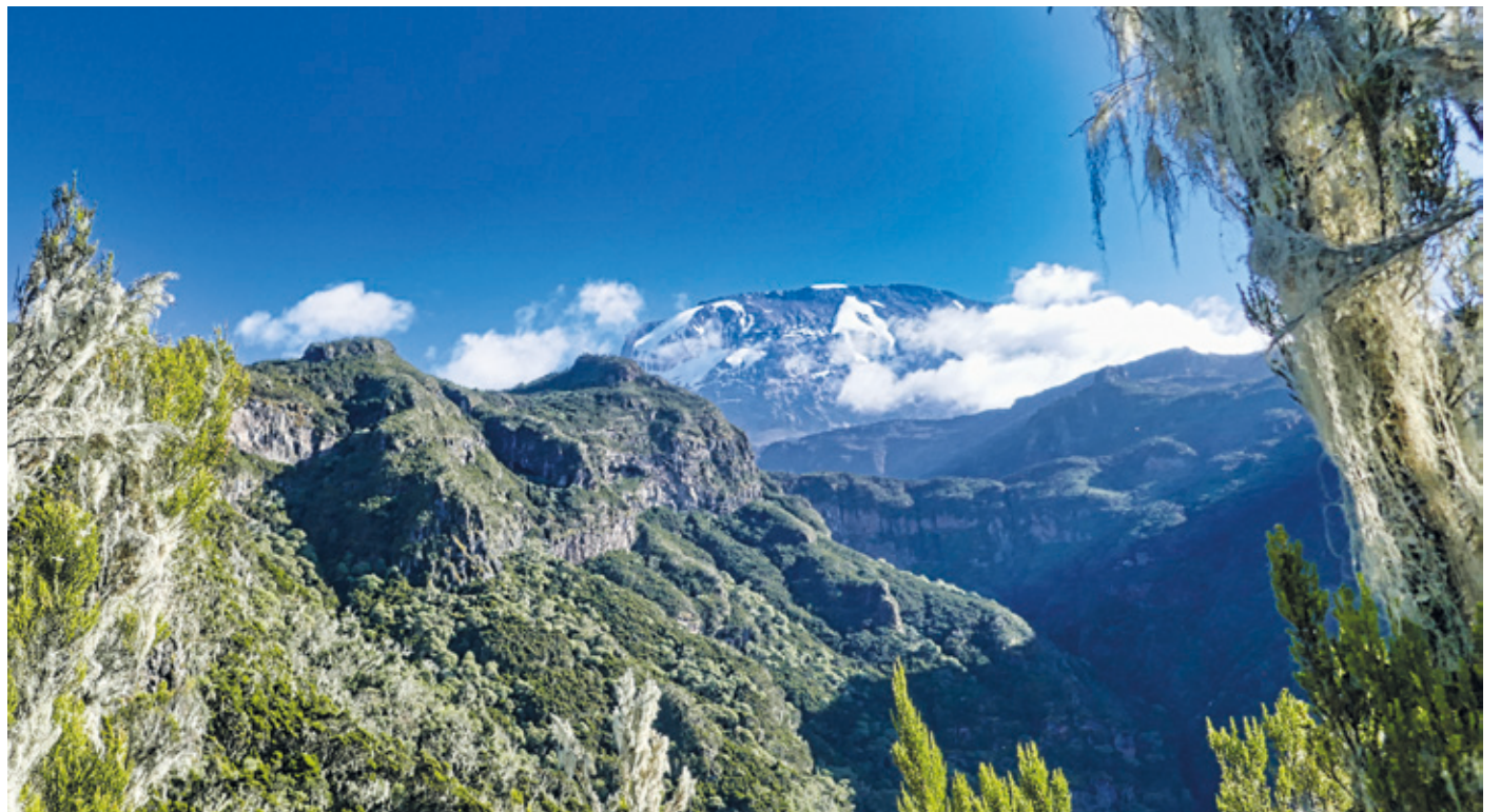
Der spektakuläre Umbwe-Kamm vor dem 5.895m hohen schneebedeckten Gipfel des Kilimanjaro.

Wiederholungstermin der neuen Live-Reportage von Stefan Seibold am Freitag, den 20. Januar 2023, um 20:00 Uhr im Bücherbahnhof Erzhausen