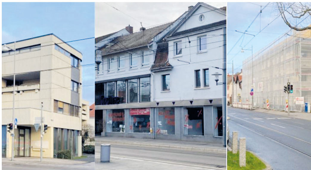
Sparkassengebäude, Möbel Kunz und altes Feuerwehrgelände.

Die AKW – eine Untergruppe der IGAB – stellt sich diese Frage