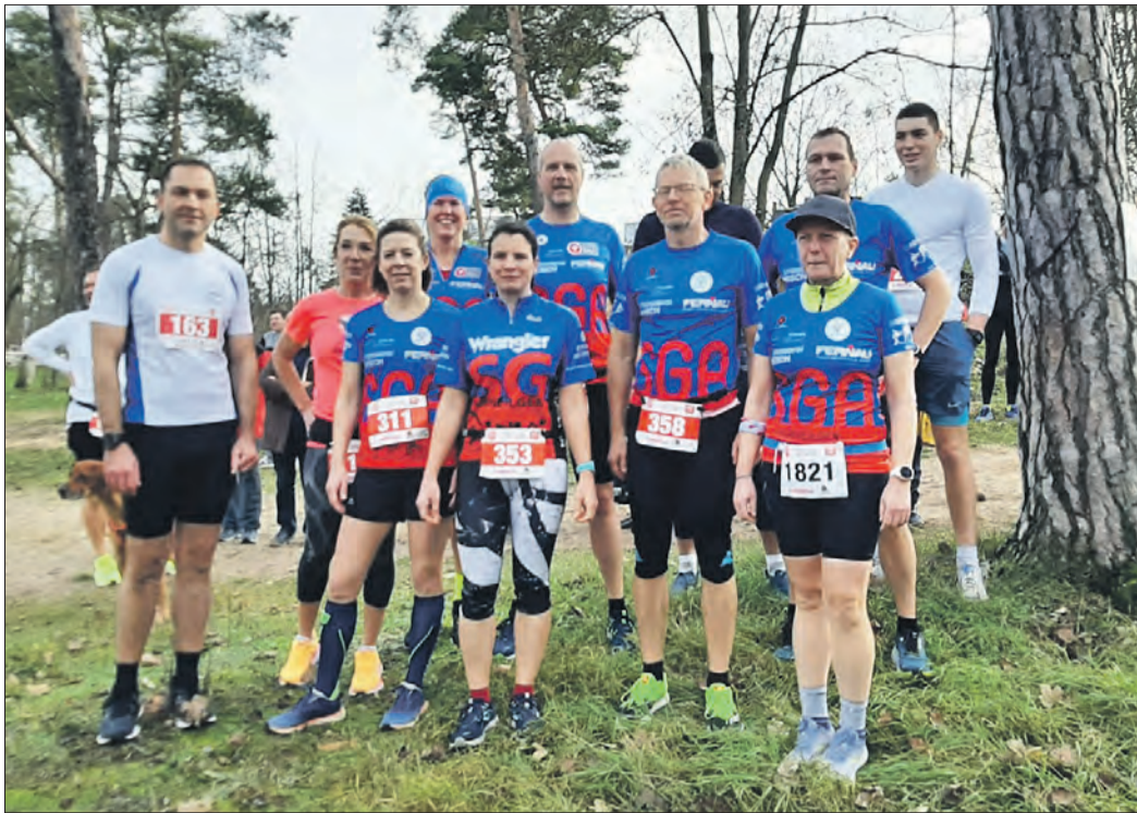
DIE SGA TRIATHLETEN beim 27. Griesheimer Silvesterlauf.