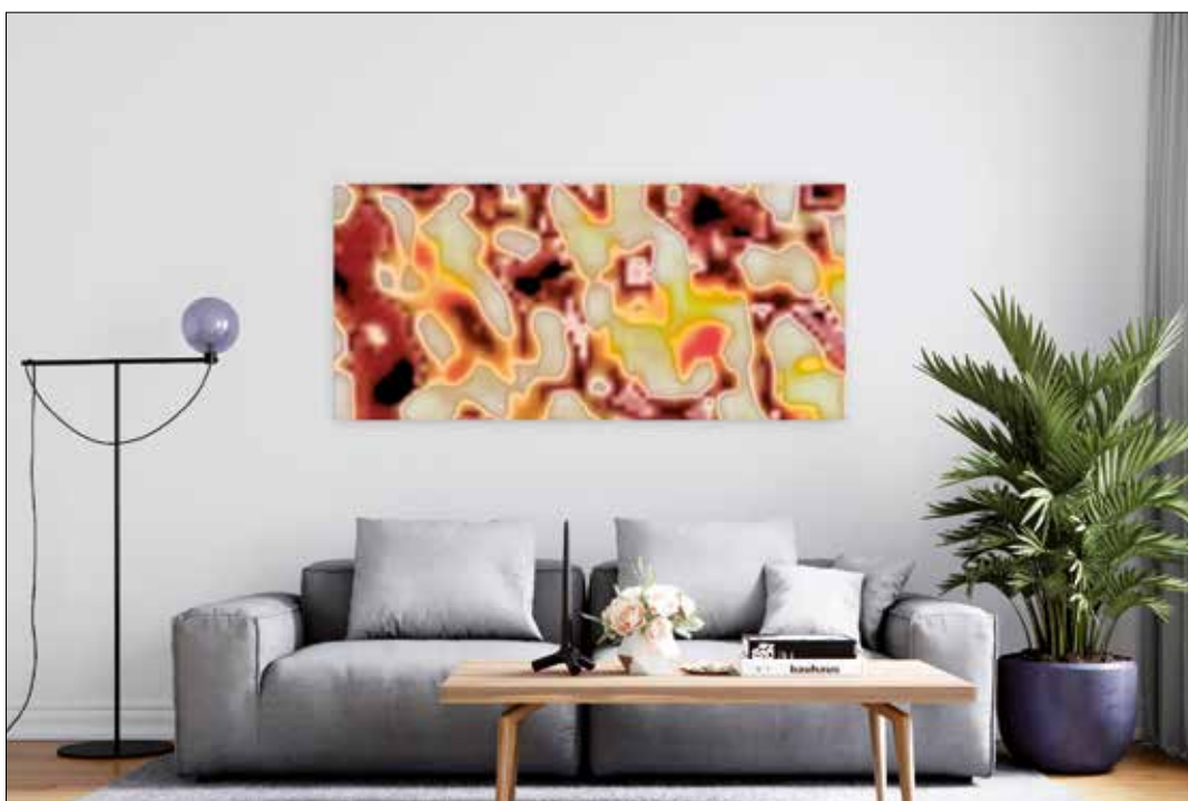
Virtuelle Platzierung der Pixografie „Intrinsic Insight 9006“ von 2021

Werner Steuer Marburger Straße 27 64289 Darmstadt Tel. 06151 9672626 www.wernersteuer.de