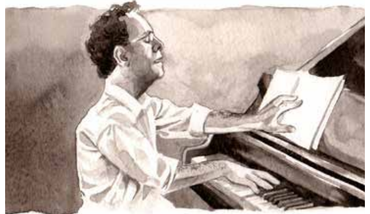
Illustration Itay Dvori