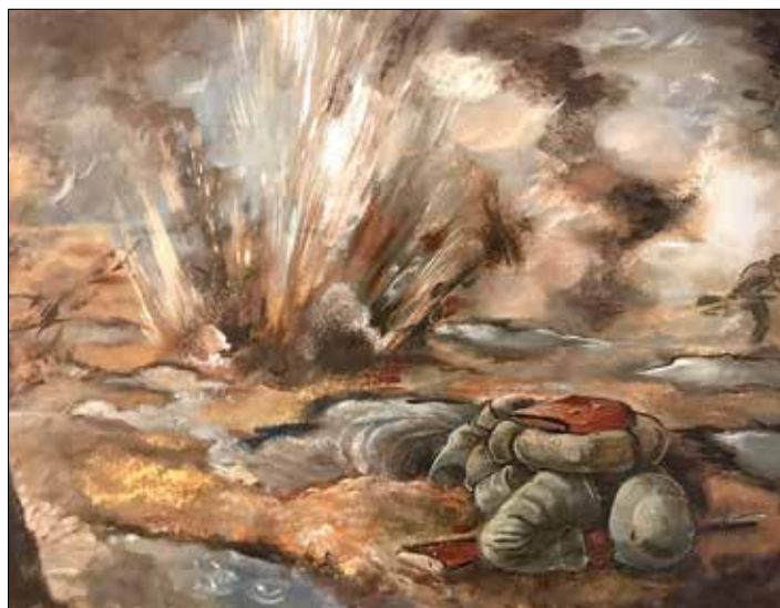
Karl Deppert, o. T. (Detonation auf dem Schlachtfeld), o. J., Tempera_KAD

Kunst Archiv Darmstadt e.V. Kasinostr. 3, Darmstadt Öffnungszeiten: Di., Mi., Fr. 10-13, Do. 10-18 Uhr Tel. 6151 291619 www.kunstarchivdarmstadt.de