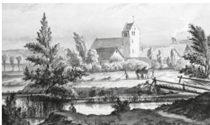
Carl Beyer: Ortsansicht von Wixhausen, Federzeichnung 1857.

(UL) Die schlechte Nachricht zuerst: Als „Berward de Wikkenhusen“ im Jahre 1173 als Zeuge vor Gericht gehört wurde, hatte niemand ein Handy dabei und darum existieren leider keine Fotos von diesem Ereignis. Auch Ritter Siegfried von Wixhausen, der 1225 in den Geschichtsbüchern erwähnt wird, hatte offensichtlich kein Interesse an der Fotografie. Sonst hätte er vielleicht mal ein schönes Bild von der Seenplatte machen können an der Wixhausen damals lag. Und so dürfte wohl eine Federzeichnung von Carl Beyer aus dem Jahr 1857 die älteste Ortsansicht von Wixhausen sein. Nun feiert Wixhausen in diesem Jahr das 850-jährige Jubiläum der ersten urkundlichen Erwähnung und aus diesem