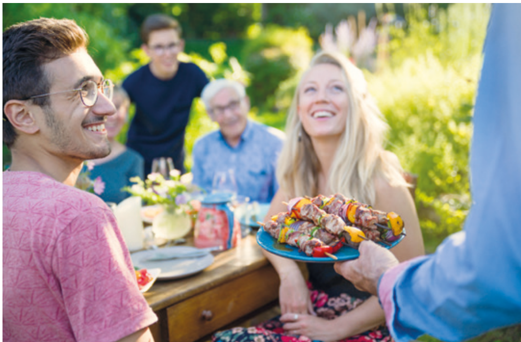
Endlich wieder Genuss am Essen. Denn Symptome wie Völlegefühl, saures Aufstoßen und Sodbrennen sind Vergangenheit.

(WLMS) Bei vielen Menschen beginnen kurz nach der Nahrungsaufnahme die Probleme. Druck im Oberbauch, saures Aufstoßen, Völlegefühl, Magenbrennen bis hin zu heftigen Magenschmerzen. Häufige Diagnose: Funktionelle Dyspepsie (FD), also Reizmagen. Mit Innovall® FD kommt nun eine studiengeprüfte, brandneue Zusammenstellung zweier spezifischer, für die Magengesundheit wichti-