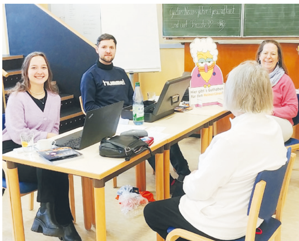
Das Team der Heag mobilo während der Beratung bei den Aktiven Senioren Wixhausen.

Infos bei den DRK Aktiven Senioren Wixhausen