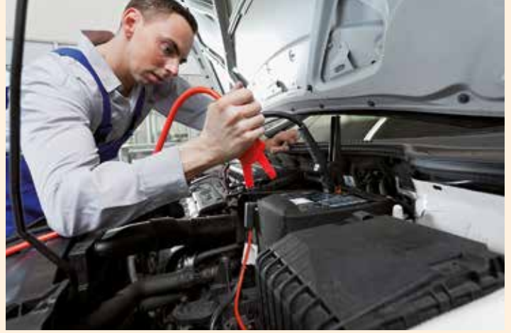
Gibt es Probleme mit der Batterie, schafft die Werkstatt zumeist schnelle Abhilfe.

Ist die Batterie hingegen noch intakt, aber trotzdem entladen, liegt es meist am Nutzerverhalten. Denn Kurzstrecken und die dauernde Nutzung von Scheiben-, Sitz-, Spiegel- und Lenkradheizung bringen die Ladebilanz des Generators ins Minus. Zusätzlich sorgen niedrige Temperaturen dafür, dass die chemischen Reaktionen verlangsamt ablaufen, die Batterie also den Strom gar nicht aufnehmen kann. Wie lässt sich Abhilfe schaffen? Möglichst Kurzstrecken vermeiden und die Batterie extern mit einem geeigneten Ladegerät nachladen. Aber auch große Hitze schadet dem Akku, denn dann verdunstet zu viel des Wasseranteils aus der Säurefüllung. Ein Nachfüllen von destilliertem oder demineralisiertem Wasser ist bei den heute üblichen wartungsfreien Batterien kaum noch möglich, die Lebensdauer sinkt extrem. Deshalb unbedingt darauf achten, dass eine eventuell vorhandene Wärmeisolierung der Batterie vollständig und nicht beschädigt ist. Aber auch eine verschmutzte Batterie altert schneller, denn dadurch steigt die Selbstentladung. Das Gehäuse sollte deshalb zwischen den beiden Polen stets sauber gehalten und die beiden Polklemmen gegen Oxidation mit etwas Polfett behandelt werden.