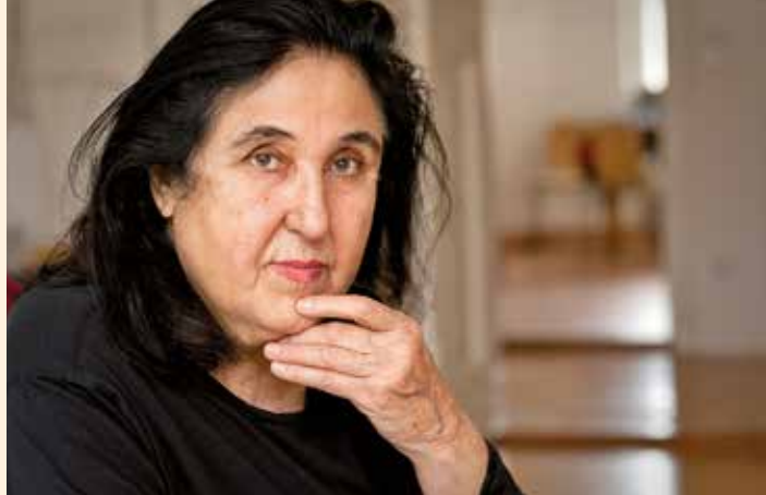
Büchnerpreisträgerin Emine Sevgi Özdamar kommt in die Büchnerstadt.

next125 Miele SIEMENS LEICHT schüller. BLANCO