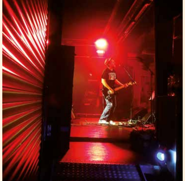
PLEIL tritt bei „Kultur in de Dusch“ auf.

Der Erscheinungstermin der März-Ausgabe des FORUM Magazins ist am 25. Februar 2023 Der Anzeigen- und Redaktionsschluss für die nächste Ausgabe ist am Montag, 13. Februar 2023.