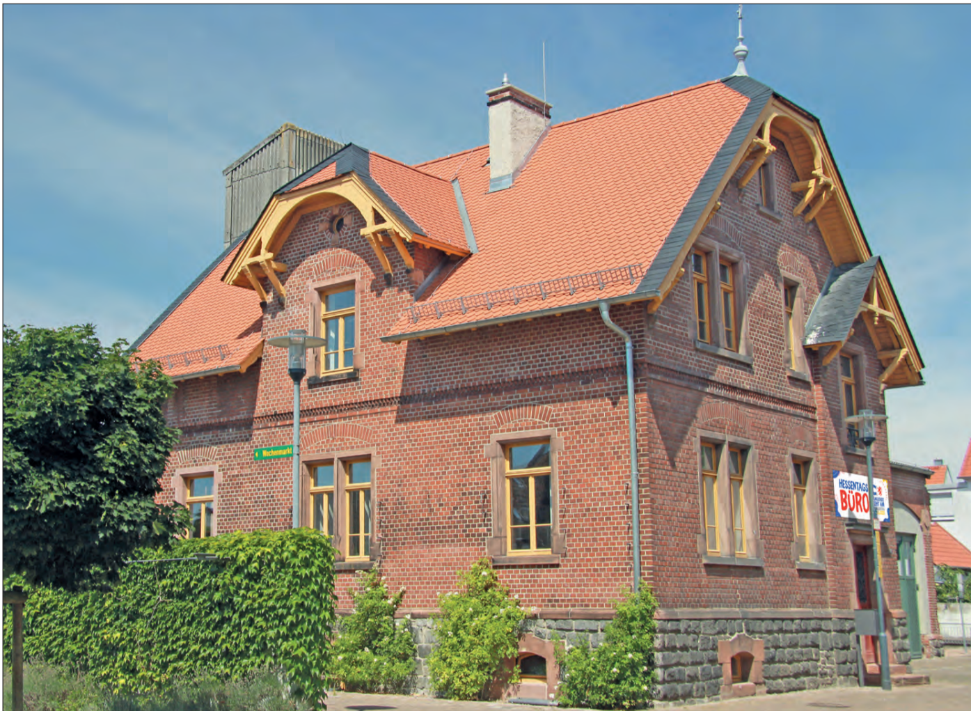
Das Alte E-Werk in der Brunnenstraße in Pfungstadt wird als Hessentagsbüro umfunktioniert.