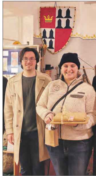
Gäste aus Amerika.

des Modells der Burg Tannenberg dar. Großes Interesse fand dann die Besichtigung von Steinkugel-Munition von der Belagerung und Zerstörung der Burg Tannenberg (Amtssitz der regionalen Herrschaft bis 1399) und der folgende Spaziergang zum Amtshaus (Amtssitz ab 1399), zum Historischen Rathaus und eine Führung von Pfarrer Sames zur Laurentiuskirche mit der Sebastianskapelle am Kirchturm und dem alten Taufbecken, an dem auch die Vorfahren Bergsträßer und Loos im 17. Jahrhundert getauft wurden. Während des Mittagess-