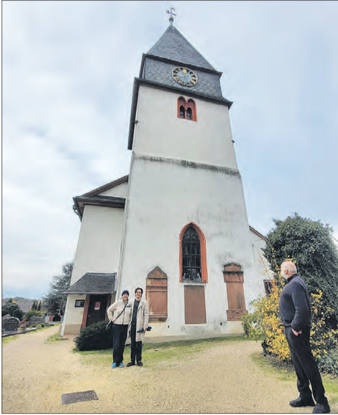
AUCH DIE KAPELLE IN MALCHEN stand auf dem Besuchsprogramm.