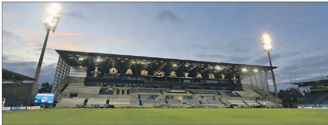
LOS GEHTS VOR VOR DER NEUEN HAUPTTRIBÜNE.