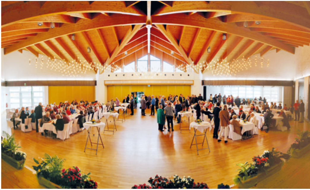
Der große Saal des Bürgerhauses war gut gefüllt.