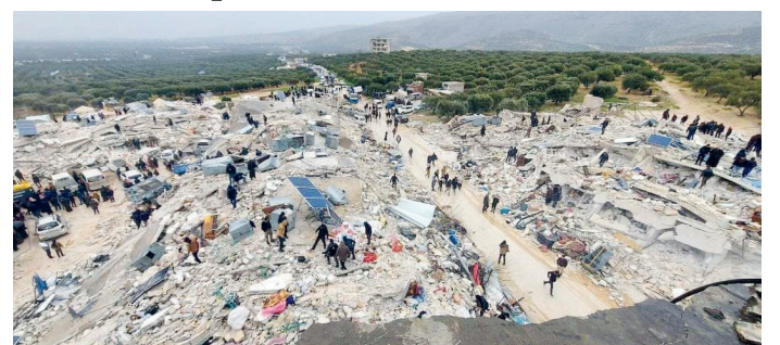
Komplett zerstörtes Flüchtlingslager in Nordsyrien.

Wie Sie den Medien entnehmen konnten kam es von Sonntag auf Montagnacht gegen 4:30 Uhr in den Regionen Süd-Türkei, Süd-Ost-Türkei und Nord-Syrien zu Erdbeben der Stärke 7,4. In der Region in Nord-Syrien gibt es ca. 1,7 Millionen geflüchtete Menschen, die auf sehr engem Raum in Flüchtlingslagern untergekommen waren. Viele dieser Häuser sind jetzt zerstört. Die Menschen wurden im Schlaf überrascht. Daher ist die Anzahl der Opfer auch sehr hoch (Zahl Montag Nachmittags: 2.300 Tote). Wir haben mit Leuten vor Ort telefoniert und sie haben uns um Hilfe gebeten, da viele Flüchtlingslager komplett zerstört wurden. Zur Zeit sind die Temperaturen dort eiskalt und es gibt sogar Regen, was die Lage noch verschlimmert. Wir brauchen dringend Zelte, Matratzen und Decken. Die Krankenhäuser wurden größtenteils zerstört wodurch auch hier der Bedarf an Matratzen, Decken sowie Verbands- und Versorgungs-