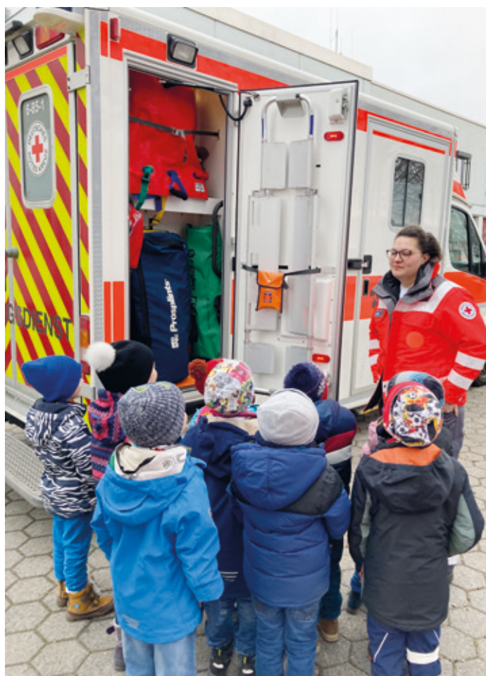
Alle Teile des RTWs wurden inspiziert.

(Erzhausen, BD) Diesen eher merkwürdig klingenden Umstand konnten die Vorschulkinder der KiTa Regenbogen in der vergangenen Woche erfahren. Im Rahmen eines Erste-Hilfe-Projekts der Schuliwerkstatt lernten die Kinder altersgerechte Grundlagen zur Ersten Hilfe, wie beispielsweise den Notruf oder das Anlegen von Verbänden. Das Highlight des Vormittags war allerdings der Rettungswagen, in dem jeder Winkel untersucht werden durfte. Die Kinder ließen sich mit großer Begeisterung auf der Trage ein- und wieder ausladen, stöberten durch die sonstige Ausrüstung und staunten nicht schlecht, als dann noch das Blaulicht für einen kurzen Moment eingeschaltet wurde. An dieser Stelle möchten wir dem Engagement der Erzieher danken. Mit solchen Praxistagen können Kinder gut vorbereitet werden, falls sie selbst verunfallen oder Zeuge eines Unfalls werden. Man kann vorab Ängste abbauen, damit eine Akutsituation für alle Beteiligten weniger stressig ist. Denn: „Was ich schon kenne, das macht mir gar keine Angst!“