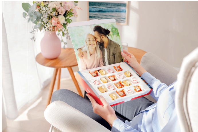
„Sweets for my sweet, sugar for my honey“: Die Foto-Schoko-box verwöhnt mit süßen Überraschungen.

(DJD-K) Der Valentinstag am 14. Februar ist der traditionelle Feiertag aller Liebenden. Doch wie kann man die Partnerin oder den Partner in diesem Jahr überraschen? Schöne Fotos lassen sich auf kreative Weise für Geschenke verwenden, die dem Liebsten mit Sicherheit ein Lächeln ins Gesicht zaubern. Einen echten Blickfang stellt eine Foto-Geschenkbox dar, die sich mit eigenen emo-