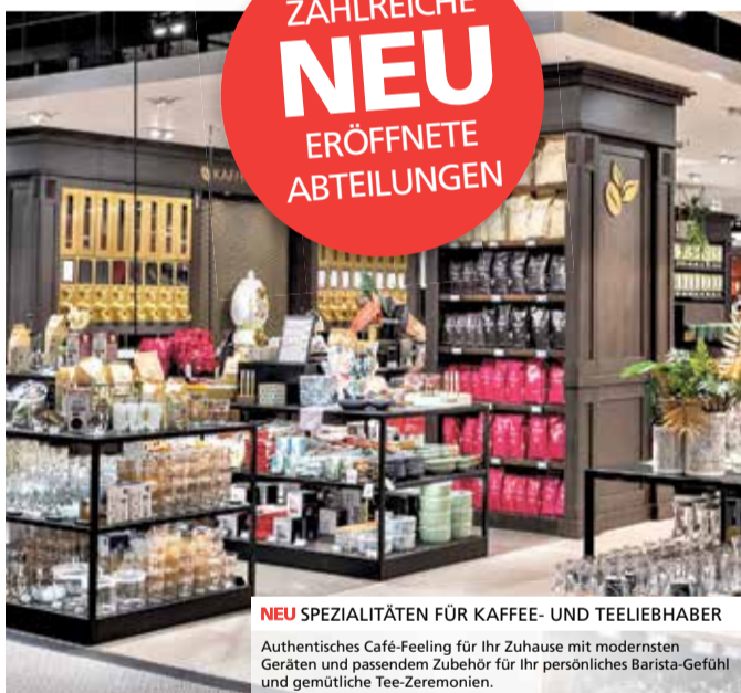
NEU SPEZIALITÄTEN FÜR KAFFEE- UND TEELEBENDER

Authentisches Café-Feeling für Ihr Zuhause mit modernsten Geräten und passendem Zubehör für Ihr persönliches Barista-Gefühl und gemütliche Tee-Zeremonien.