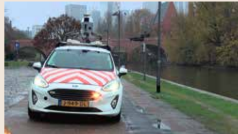
Panoramabildbefahrung am Mainufer in Frankfurt.

tems wird der Standort genau bestimmt. Ein Laserscanner sorgt dafür, dass innerhalb der Bilder präzise Abstände gemessen werden können. Von Cyclomedia bearbeitet wird das hochaufgelöste Fotomaterial dem Kunden dann zur Verfügung gestellt. Die Stadt Frankfurt nutzt die Ergebnisse u.a. für bessere Müll-Routen oder auch die Radwege-Planung. Es ist bereits die 8. Panoramabildbefahrung in der Mainmetropole.