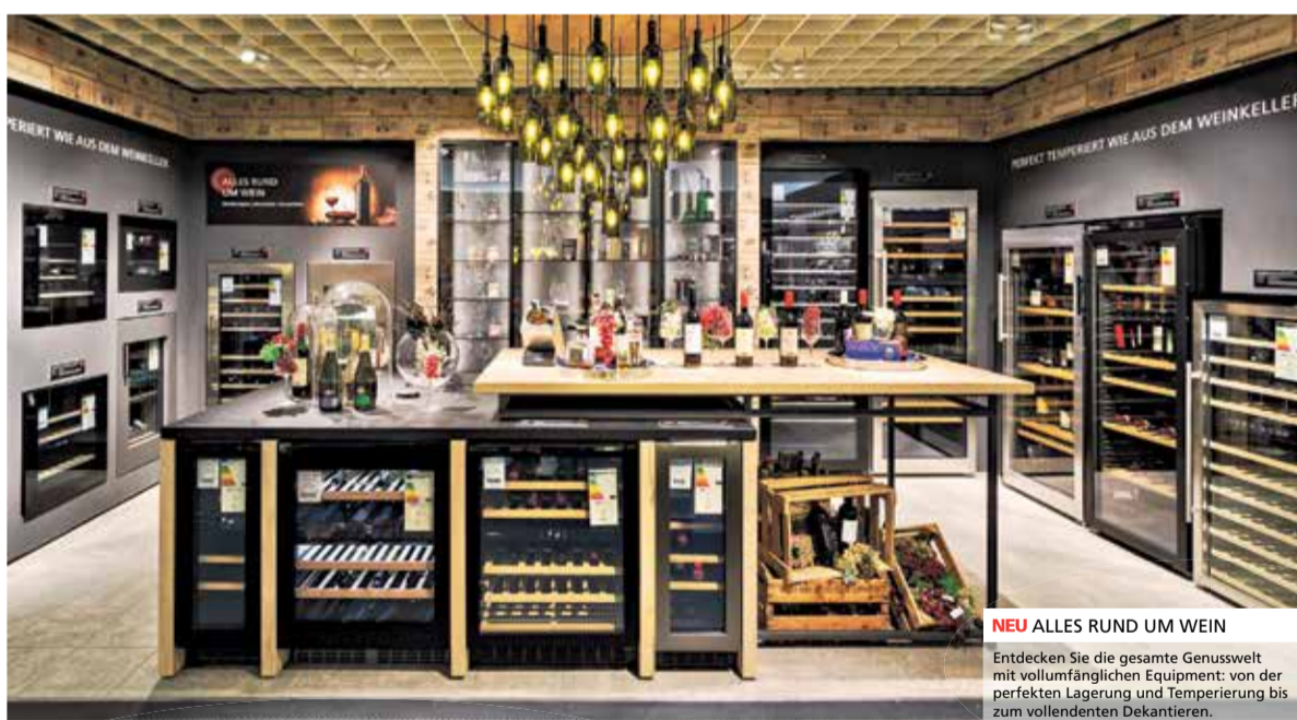
NEU ALLES RUND UM WEIN

Entdecken Sie die gesamte Genusswelt mit vollumfänglichen Equipment: von der perfekten Lagerung und Temperierung bis zum vollendeten Dekantieren.